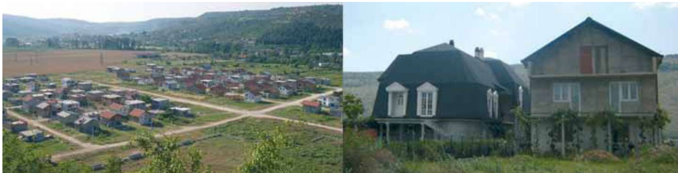
Slika 2: Gradnja novih naselij.