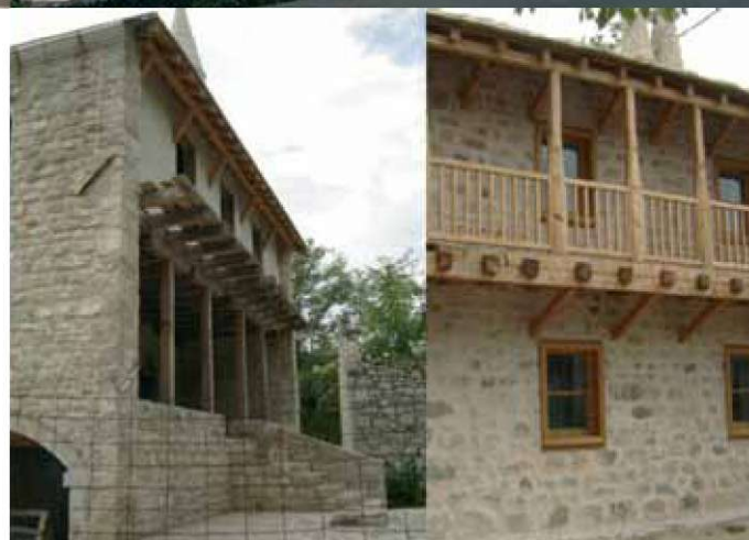
Slika 6: Mošeja Podgrad pred vojno, povojna rekonstrukcija mošeje in spremljajočega objekta (na nasprotni strani ulice).