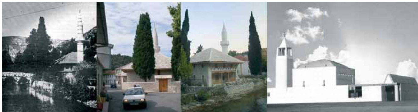
Slika 5: Hadži Ali Hadžihasanovića mešerja pred vojno, povojna rekonstrukcija (sprednja in zadnja stran) in predlog Z. Ugljena (pogled z ulice) (vir slikovnega gradiva: Hasandedić 24, zasebni arhiv avtorice, Bernik 187).

Zato je tudi zanimiva misel Ignatieffa, ki z uporabo Freudovega izraza "narcisizem manjše razlike" trdi, da ko se zunanje razlike med skupinami zmanjšujejo, postajajo simbolne razlike bolj pereče, bolj pomembne, da postanejo "maska razlikovanja" (1999). Zlasti v konfliktnih časih kulturni simboli pogosto zavzamejo značilne ikonske lastnosti, ki opredelijo in ustvarijo občutek razlike. Nasprotno, ko je ustanovljena razlika, "istost" lahko zagotovi vir legitimnosti (de Condappa 2008). Zlitje pojmov kulture in pravice predvideva močno mobilizirajočo dialektiko, ki lahko izmenično privilegira ali zanika pojmovanja legitimnosti. "Pooblastilo" za izbris kulture zato bistveno vpliva na legitimnost skupine in v skrajnih primerih na njeno pravico