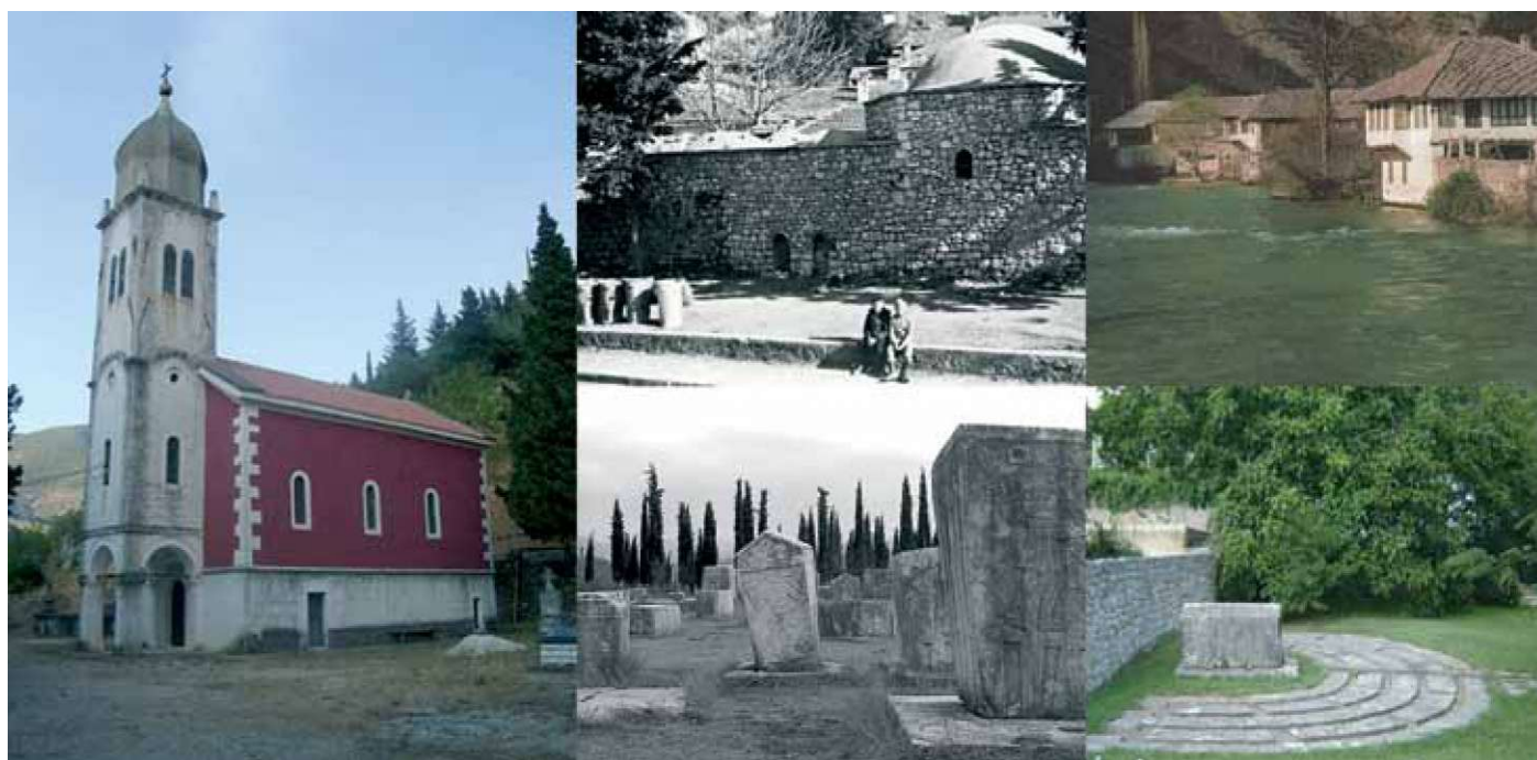
Slika 1: Zgodovinske znamenitosti v Stolcu (z leve proti desni, od zgoraj navzdol): pravoslavna cerkev iz 19. stoletja, hamam iz 18. stoletja (zrušen v zadnji vojni), Begovina (uničena v vojni), Radimlja in stecci, grob rabina M. Danona.

Stolac, verjetno najstarejše mesto v Hercegovini, se nahaja v Hercegovsko-neretvanskem kantonu, na poti, ki v smeri iz Bosne v Dubrovnik poteka po Hercegovini, natančno po porečju reke Bregava, levem pritoku Neretve, na križišču poti Mostar-Dubrovnik in Čapljina-Bileca. Od Mostarja je