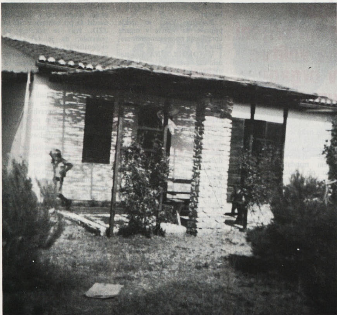
Hišica št. 104 v Nerezinah

Vsak objekt oz. družinska hišica ima na voljo spalnico z