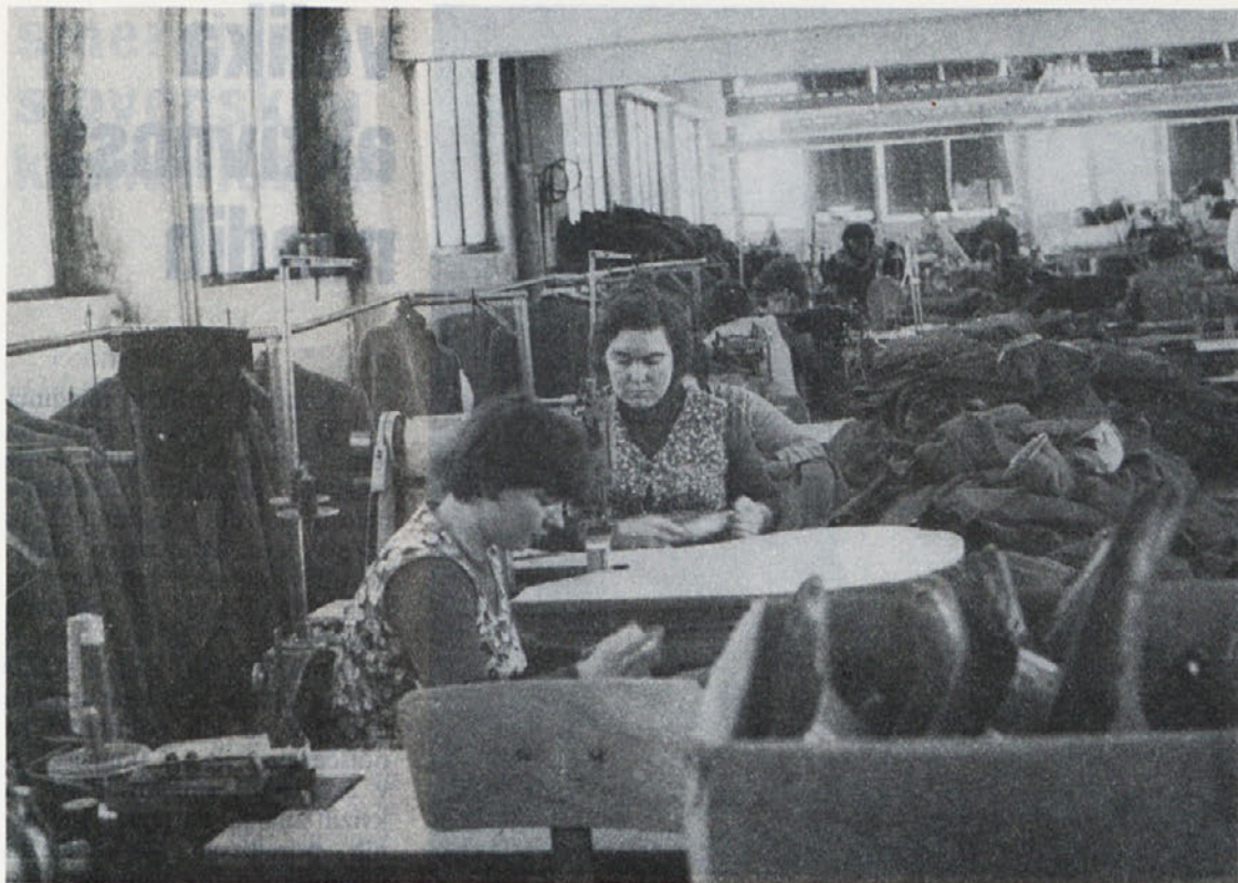
V TOZD Temenica so prišli do spoznanja, da je potrebno začeti s funkcionalnim izobraževanjem za vse brigadirje. Nujno je dopolnjevati znanje tako na strokovnem področju kot na področju organizacije dela.