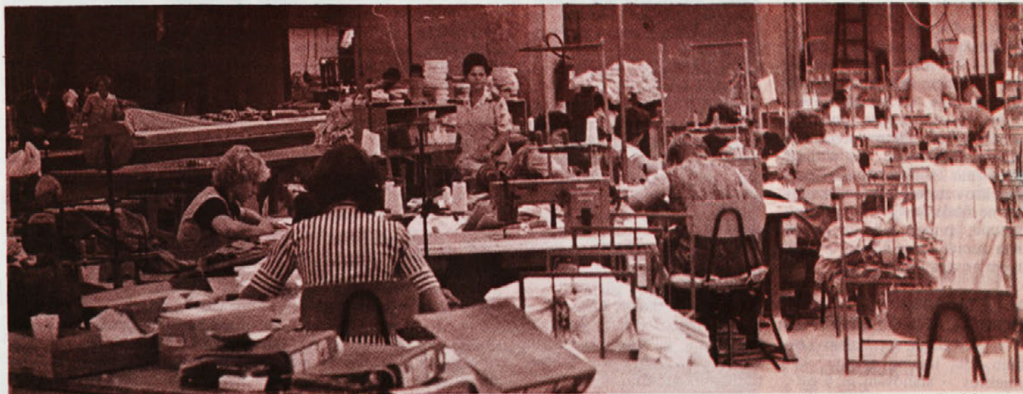
V TOZD Delta (na posnetku) in v TOZD Ločna so evidentiranje za organe upravljanja opravili skupaj z evidentiranjem možnih delegatov za SIS in družbenopolitično skupnost.

Tudi v Zali je bilo v času pogovora že vse nared, saj je bila opravljena tudi že temeljna kandidacijska konferenca. Pred tem se je sindikalna organizacija zelo angažirala okoli evidentiranja, zato menijo, da bodo tudi same volitve stekle tako kot si želijo.