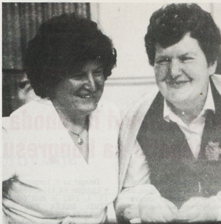
Letošnji jubilarke iz Libne.

Ocenili bomo tudi, kako smo prestali prvo medkongresno obdobje brez dveh velikanov in tvorcev našega socialističnega samoupravnega sistema, tovaršev Tita in Kardelja. Gotovo bolje, kot so se teg nadejali in upali sovražniki zunanji in znotraj naše domovine. Vendar pa ne smemo zapirati oči pred problemi, ki še vedno tlijo pod površino in bi jih sovražniki v trenutku naše nepripravljenosti lahko razpihali v požar. Prav zato je važno, da vse probleme obravnavamo odkrito in odprto, saj je naš sistem, ki je zgrajen na enakopravnosti de-