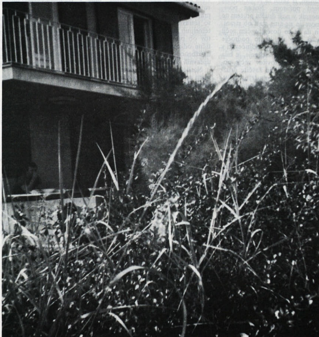
Del našega doma v Savudriji