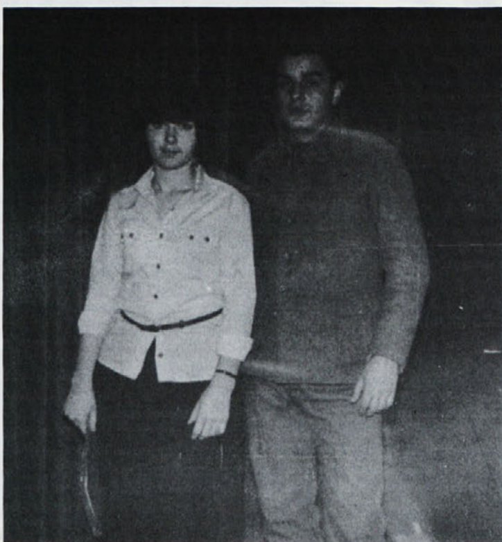
Mladina novomeškega dela Laboda dobro sodeluje z mladinci vojašnice Milan Majcen. Tudi številne kulturne prireditve so nastale v tem sodelovanju.

Sedaj se vidi, da bi moral resnično pokazati vse, da bi si pridobil zaupanje sodelavcev. Navadno se to ne zgodi takoj. Marsikdo se naveliča tega čakanja in postane pasiven do dela, še predno je delati sploh začel. Nekoliko laže je za študente, ki se nekako vključujejo v delo že vsa leta šolanja, saj so v stalnem stiku z organizacijo združenega dela v kateri bodo kasneje delali, imajo pa tudi svoje klube študentov v katerih se pogovarjajo in seznanjajo z delom, vseh družbenopolitičnih in ostalimi pomembnimi strani, ki se dogajajo v organizaciji združenega dela.