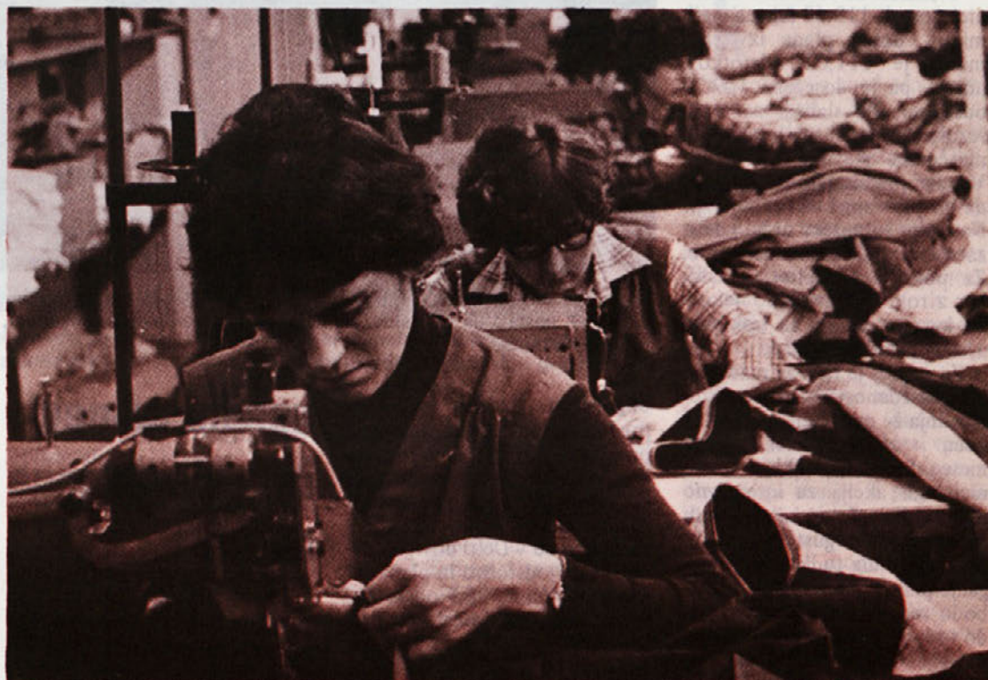
V TOZD Zala je bila dobro izvedena akcija za referendum glede samoprispevka s pomočjo katerega bo šolarjem v tej občini omogočeno lažje in uspešnejše delo.

Zastavljena naloga – preseg plana. Rezultati v mesecu marcu so zelo ugodni, saj so delavci Zale presegli plan in normo. Plan je dosežen 110 odstotno, norma pa 106 odstotno. Po mnenju tov. direktorice je tako doseganje norme – po lanskim popravkih – za to delovno sredino kar najvišje možno. Dogovor odgovornih delavcev ob osvajanju kolekcije za jesen – zimo zavezuje TOZD Zalo za