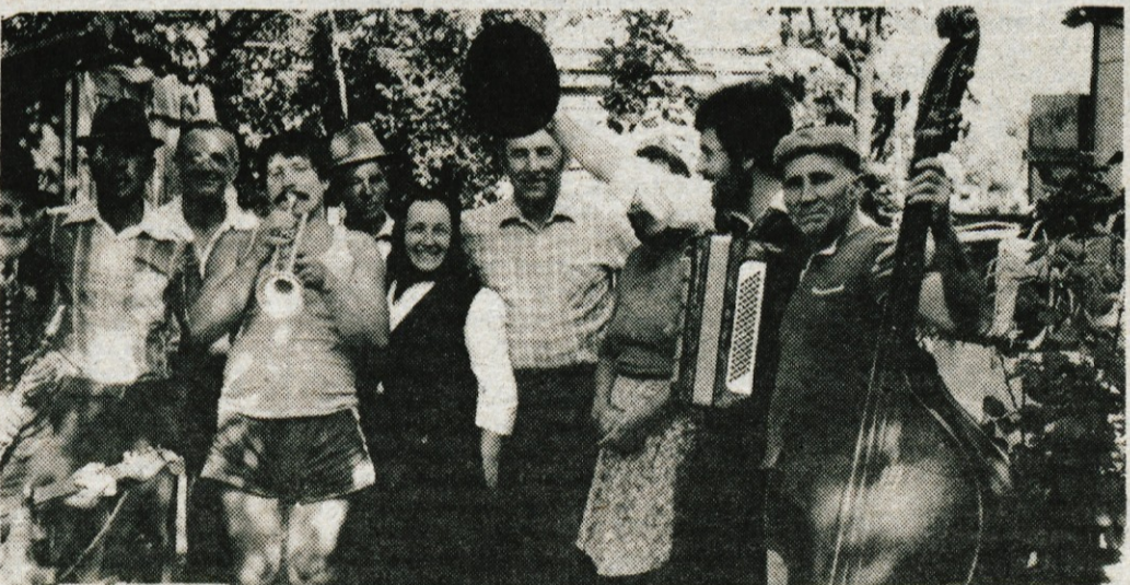
Še zadnji juhuhu pred slovesom z gostoljubnimi vaščani iz Punitovcev.