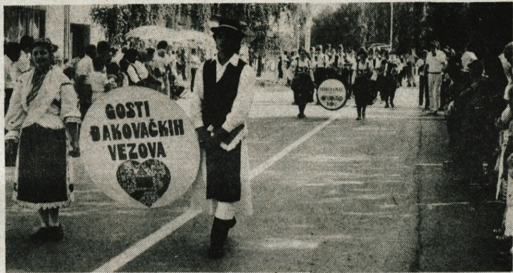
Po djakovskih ulicah je zaplesalo in zapelo petinštirideset folklornih skupin.