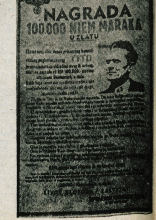
Nemška tiralica za Titom, ki je bila objavljena sredi leta 1943 na območju Hrvaške