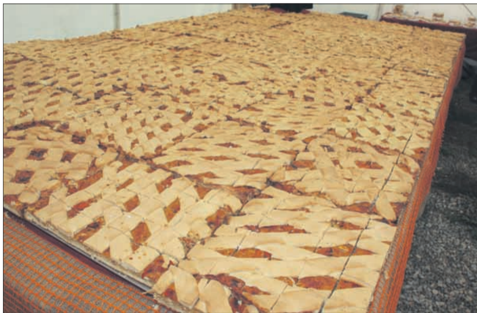
Ogromna kakijeva pita

Sredi novembra se je v Strunjanu končal tridnevni, deseti jubilejni praznik kakija, ki ga je obiskalo več deset tisoč ljudi iz vse Slovenije. Organizatorji, tamkajšnje turistično društvo Solinar, pridelovalci kakija ter številni drugi, so pripravili zares odlično prireditev, ob kateri je imel svoje častno mesto prav kaki. Ob tem so pridelovalci prodali velik delež letošnje več kot odlične letine.