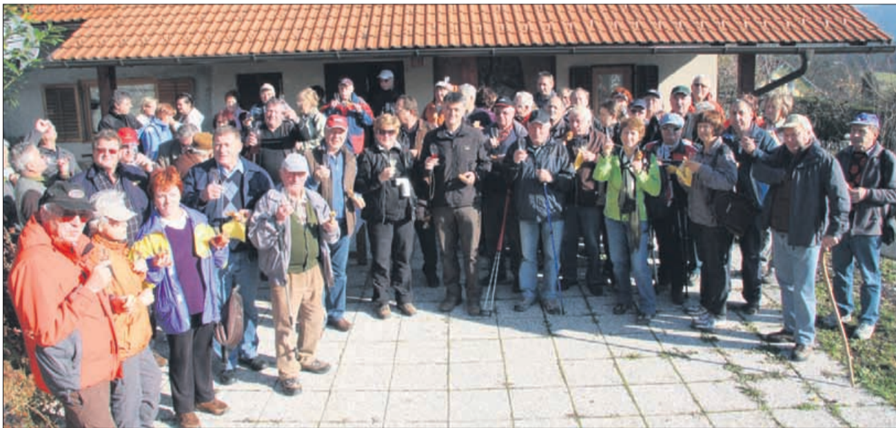
Pri zidanic Turistične kmetije Rotovnik