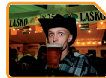
Avtor: GrupA – Andraž Purg