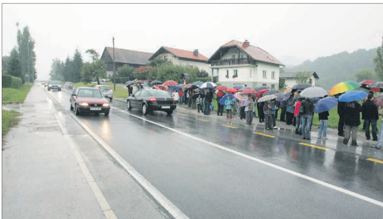
S protestnega shoda vaščanov Prožinske vasi v začetku septembra, ko so zahtevali večjo prometno varnost. Šolski avtobus že vozi, kje pa je vse ostalo?