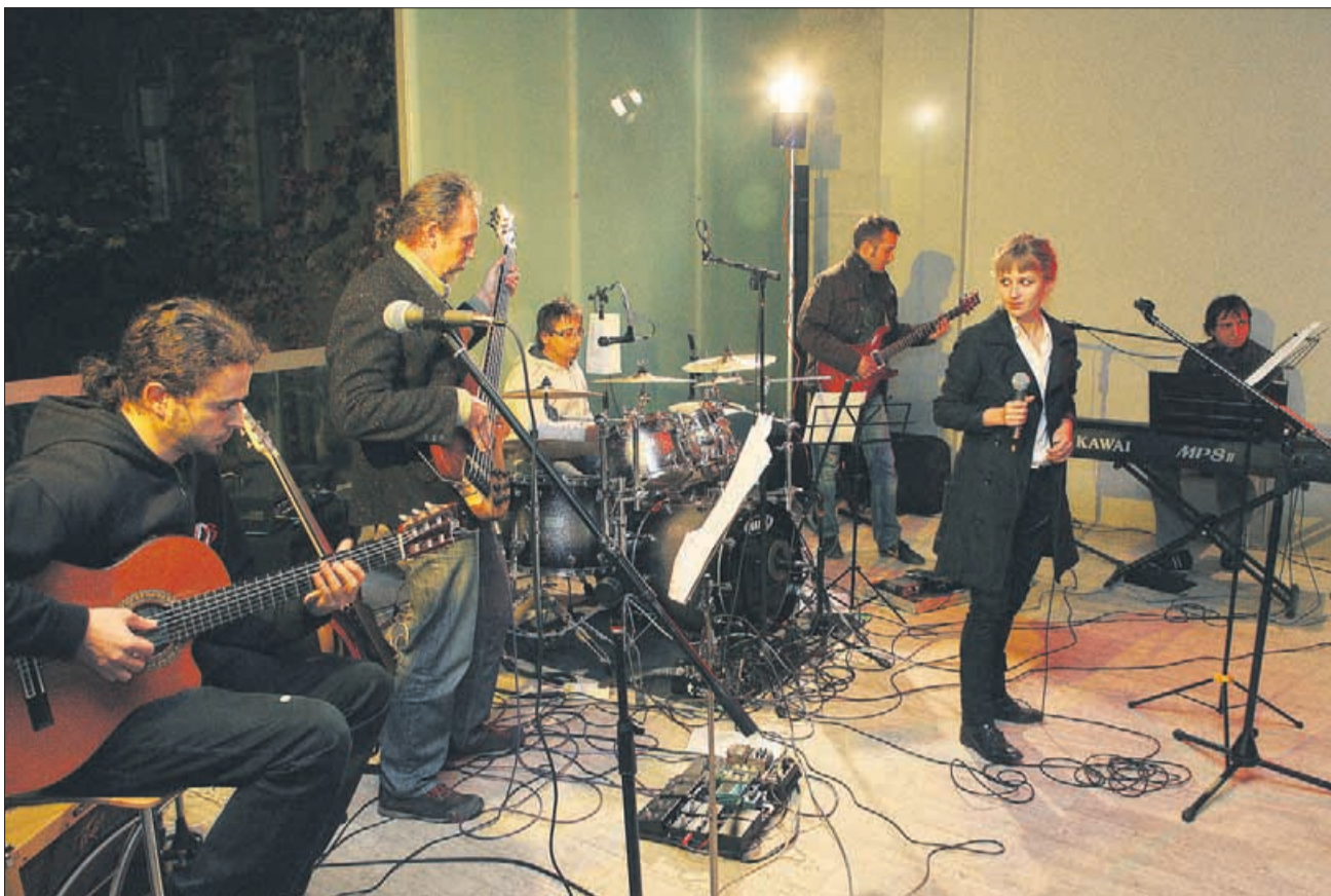
Tuned fish so v Celju nazadnje nastopili sredi oktobra na koncertu pred Osrednjo knjižnico Celje.