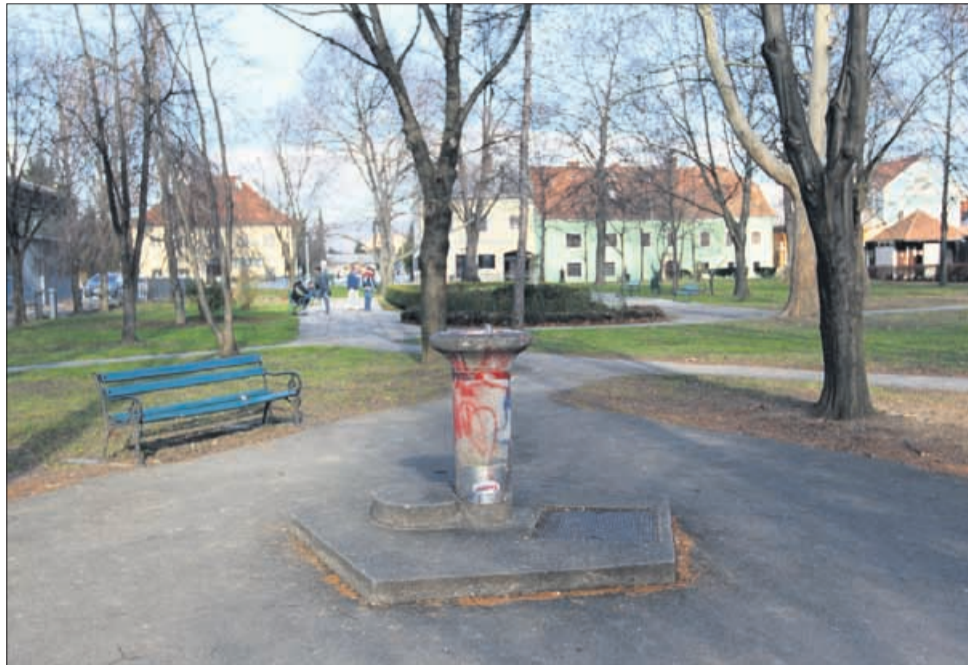
Najbolj črne točke, kjer se zbirajo odvisniki na žalskem območju, so mestni park, zapuščene stavbe, okolica šol in vrtcev ter stranišča v nakupovalnih centrih. Po zaslugi rednega pobiranja igel in drugih odvvrženih pripomočkov v parku, nedaleč stran od Želve, sredi belega dne ni bilo slutiti, da se Žalec že nekaj let otepa z velikim številom odvisnikov, ki prihajajo v tamkajšnji dnevni center.

Dnevni center za odvisnike Želva po skoraj desetih letih od ustanovitve ostaja edini tovrstni center na Celjskem. Gre za ustanovo z nizkopražnim programom, namenjeno mladostnikom od 14. do 25. leta, ki uživajo droge, in njihovim svojcem. Vanj je trenutno vključenih 82 pomoči potrebnih. Od tega jih skoraj polovica prihaja iz žalske občine. Ostali so iz Celja, Velenja, s Polzele, iz Braslovč, Prebolda, Mozirja, Nazarij, Šmarja, Rogaške Slatine ter celo iz Slovenj Gradca in drugod. Vrata centra so odprta vsak dan med 6. in 16. uro, medtem ko je menjava igel in oskrba s higienskimi in drugimi pripomočki na voljo 24 ur na dan. V prostorih centra je tudi zavetišče. Odprto je ves dan. Namenjeno ni le odvisnikom, temveč tudi tistim, ki imajo težave z alkoholom, psihične težave ali so invalidi. Zavetišče deluje peto leto in sprejme 14 oseb, trenutno pa jih tam domuje devet. Zaradi prevelike koncentracije odvisnikov in drugih pomoči potrebnih, ki dnevno prihajajo v edini dnevni center in zavetišče tod okoli, je temu primerna tudi stopnja ogroženosti občanov zaradi konfliktnih situacij z nekaterimi objestneži.