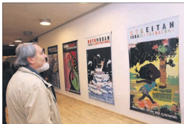
Najlepše ilustracije iz izraelskih knjižnih izdaj so povečali na format posterjev, s čimer so dobile še dodatno dimenzijo.