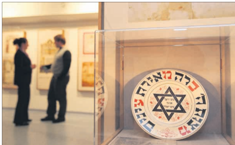
Replike starodavnih zapiskov so, s pripadajočim okrasjem vred pričevalci obrtniške in umetniške spretnosti hebrejskih piscev.