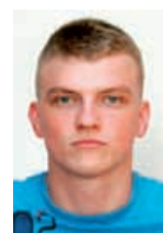
TimE Tim Einspieler