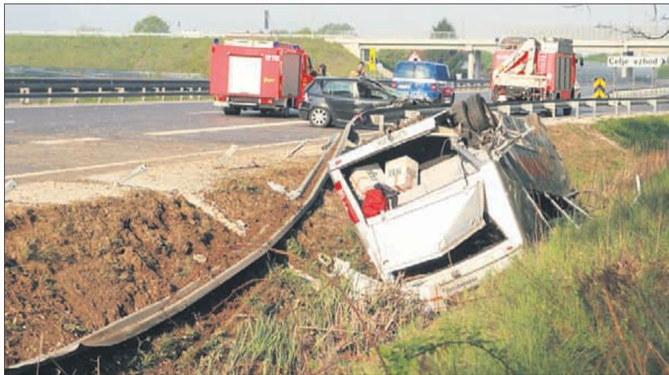
Po mnenju Niegelhellovega zagovornika je sporno mnenje prometnega izvedenca o tem, kako so nastale poškodbe na zadnjem delu avtobusa. Te naj bi kazale na to, da se je Niegelhell avtobusu izmikal, ker naj bi avtobus nenadoma zapeljal na levo.

Niegelhellu so pred meseci izrekli tudi prepoved vožnje motornega vozila in odvzem vozniškega dovoljenja za 2 leti. To pomeni, da dve leti po prestani kazni ne bo smel voziti – če bo sodba okrožnega sodišča obveljala. Tožilka Ma-