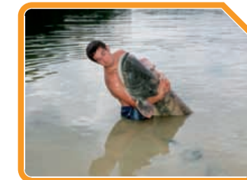
Avtor: TimE – Tim Einspieler