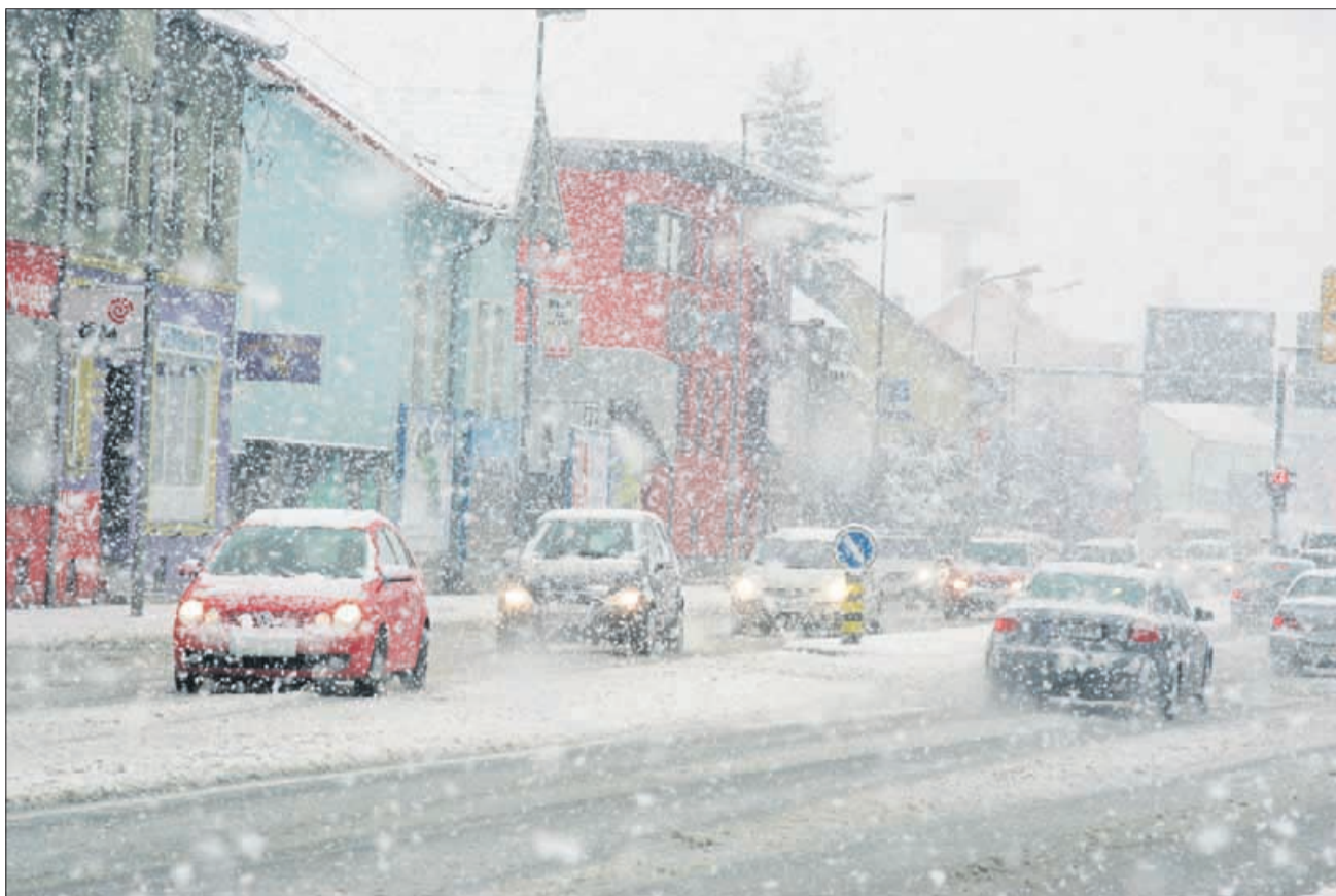
Lanska zima izvajalcem zimske službe ni pustila počivati.

Ljudje se na eni strani pritožujemo, če ceste niso takoj spužene in posute. Po drugi strani pa se zaradi korozije avtomobilov, ogrožanja rastlinstva in pitne vode postavlja vprašanje uporabe soli proti poledici. »Ker bi bila prometna varnost ogrožena, popolna opustitev soli trenutno ni mogoča. Nadomestitev soli s kamnitimi posipnimi materiali je ob današnjem prometu neracionalna in neučinkovita. V tem primeru ne bi pridobili niti pri znižanju stroškov, kakor tudi ne pri varnosti prometa. Ekonomske koristi pri uporabi soli so nekajkrat večje od stroškov in škode, ki jo povzročajo, zato pri posipanju v zimski sezoni uporaba soli še vedno prevladuje,« pravijo na MOC.