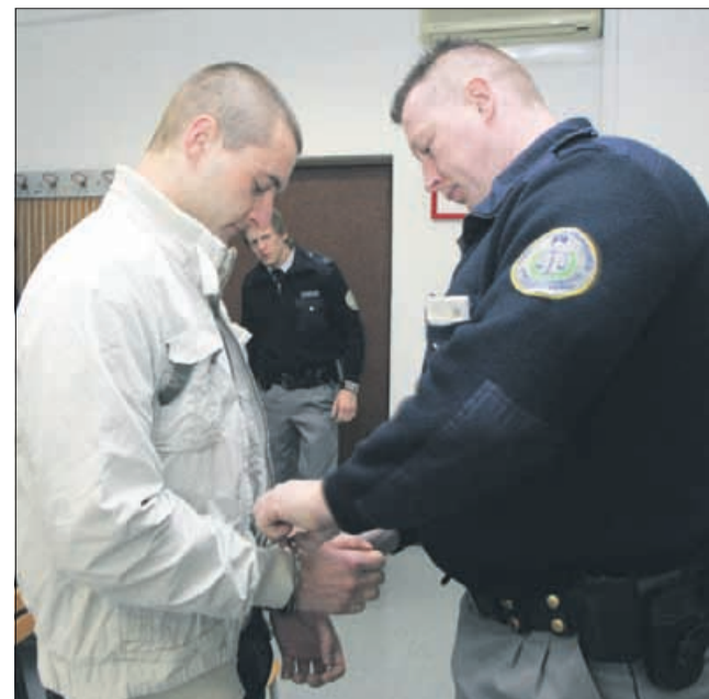
Vasji Niegelhellu tokrat niso odstranili lisic med obravnavo.

tožbi kot že na samem sojenju omenil, da se nikakor ne strinja z ugotovitvami cestnoprometnega izvedenca, ki naj bi po njegovem izdelal pomanjkljivo mnenje o nesreči in sodba, ki sloni na tem, ni trdna, je dodal. Zato je višjemu sodišču predlagal, da sodbo razveljavi in okrožnemu sodišču naloži zaslišanje novega prometnega izvedenca in še izvedenca za tahografe, saj je – kot