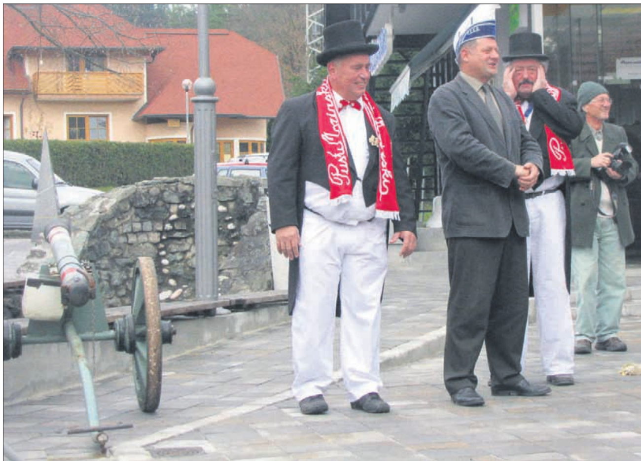
Zaradi spornega topa se je pustni župan (desno) zaman držal za ušesa.