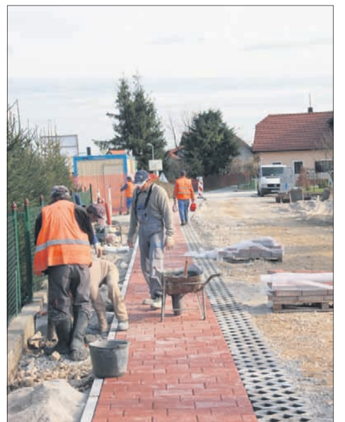
V Rakovljah pridno zaključujejo dela na sekundarni kanalizaciji, medtem ko bo dela na primarni mogoče dokončati šele prihodnje leto.