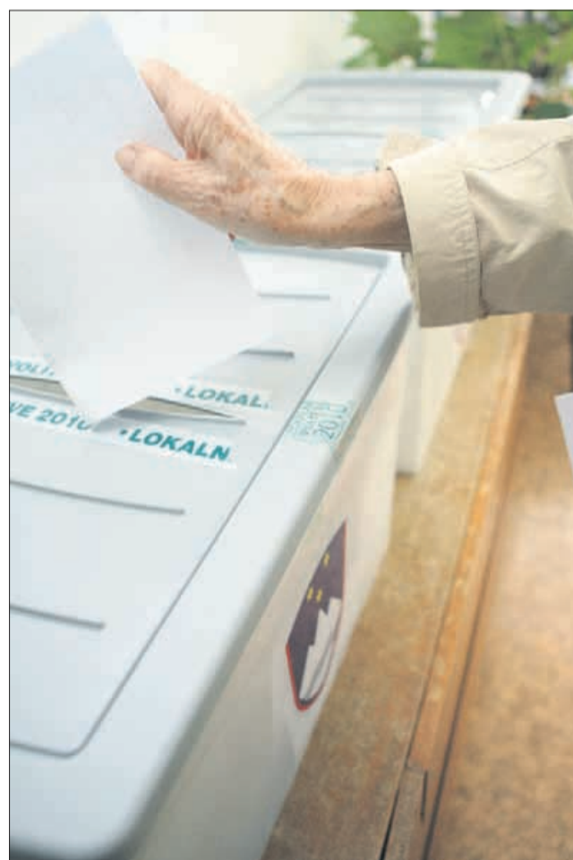
V Rogaški Slatini naj bi bilo na zadnjih lokalnih volitvah več glasovnic kot volivcev. Po anonimni prijavi zadevo raziskuje pet kriminalistov.