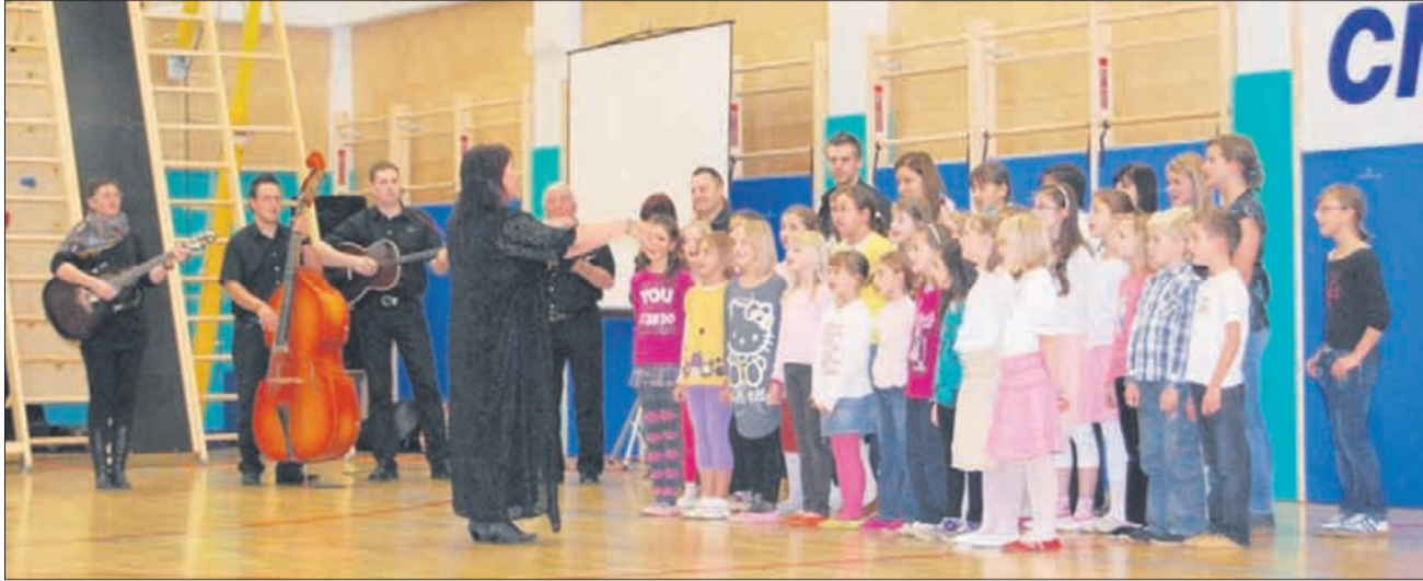
Za otvoritev šentviške dvorane so med drugim pripravili zanimiv kulturni program.

V Šentvidu pri Grobelnem so tudi uradno odprli novo športno dvorano podružnične osnovne šole, ki jo več kot sto otrok iz šole in vrtca uporablja že od začetka šolskega leta. Zaradi predvolilnega časa so uradno odprtje predstavili na čas po lokalnih volitvah.