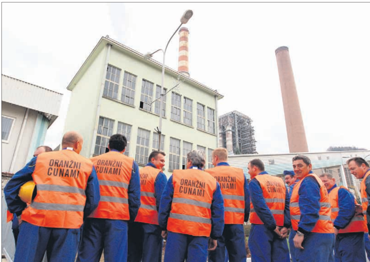
Podpis verjetno ni potreben.