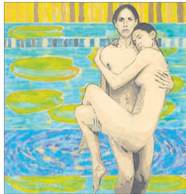
Med razstavljenimi deli je tudi slika z naslovom Sestri.