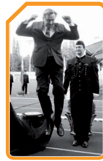
Avtor: Sherpa – Edi Einspieler