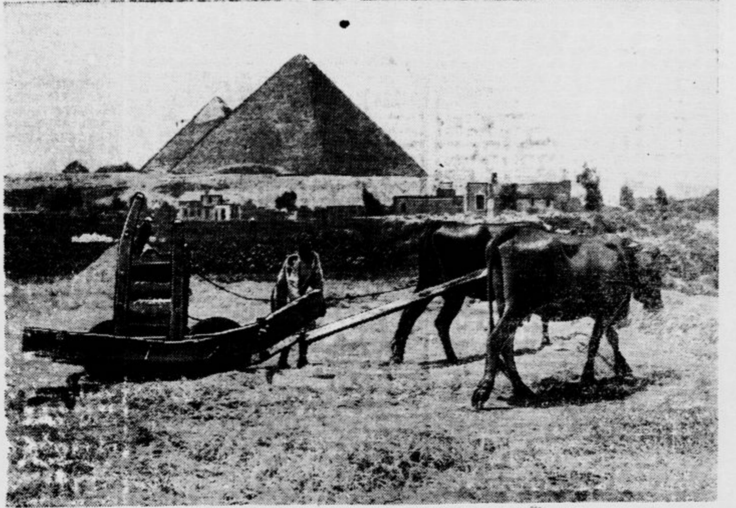
Svojevrsna mlaticnica v senci egiptovskih piramid

»Kje si pa more siromak kupiti prave plenice. Mnogi še starih jank ne premo-