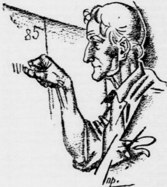
Oče zarzuje mernike