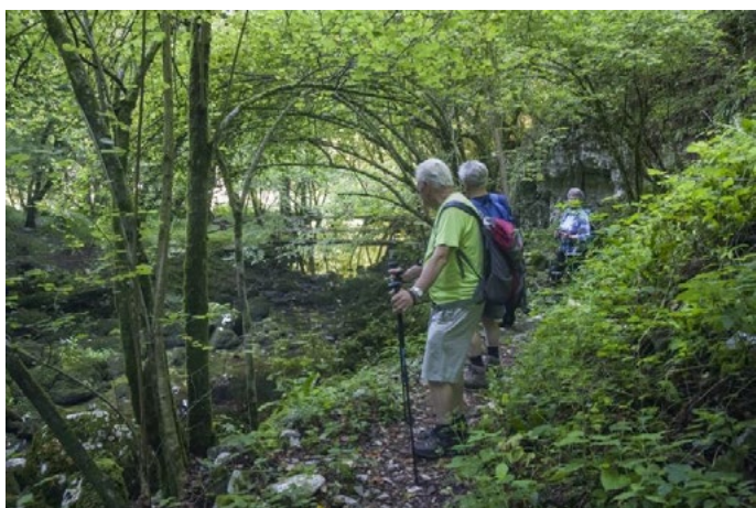
19. avgusta smo se z vlakom odpeljali do Podhoma in skozi Vintgar šli do vlaka na Bled.