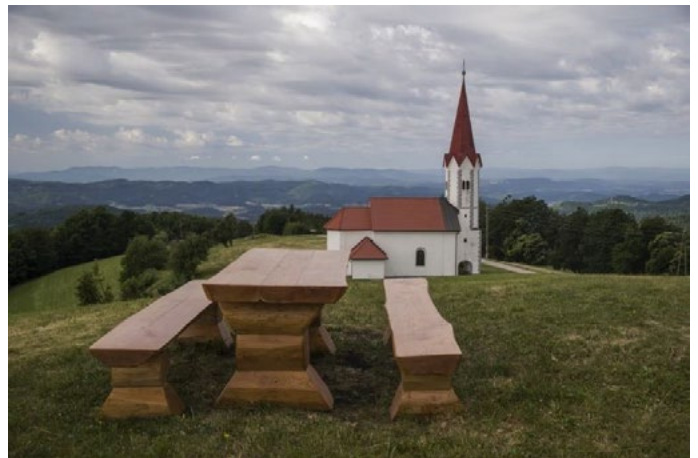
8. julija smo bili na Ješivcu.