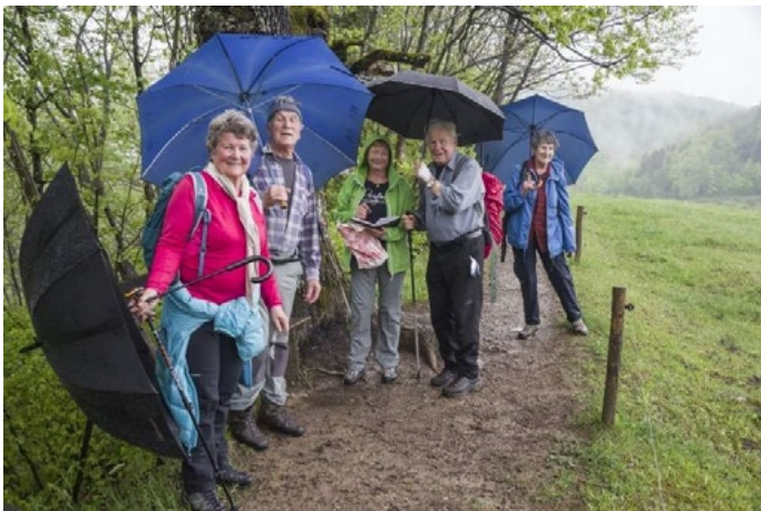
13. maja smo odšli na zanimivo turo nad Dobje. Na Handilu je tudi zavetišče in za pohodništvo privlačno območje.