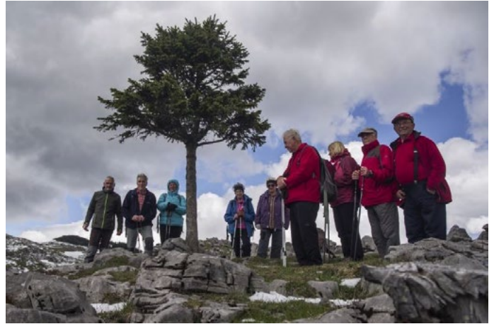
27. maja smo obiskali okolico Šentruperta in naselja Okrog.