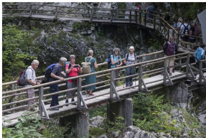
2. septembra smo odšli na manj obiskano zanimivo območje na Dolenjskem – Lisec.