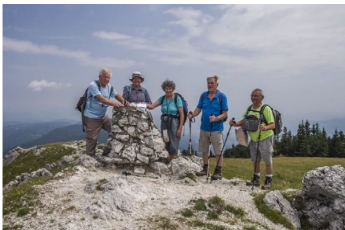
29. julija smo bili na Lovrenških jezerih.