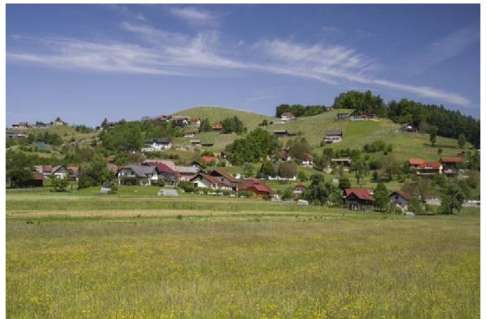
3. junija smo bili na Kopitniku in Gorah.