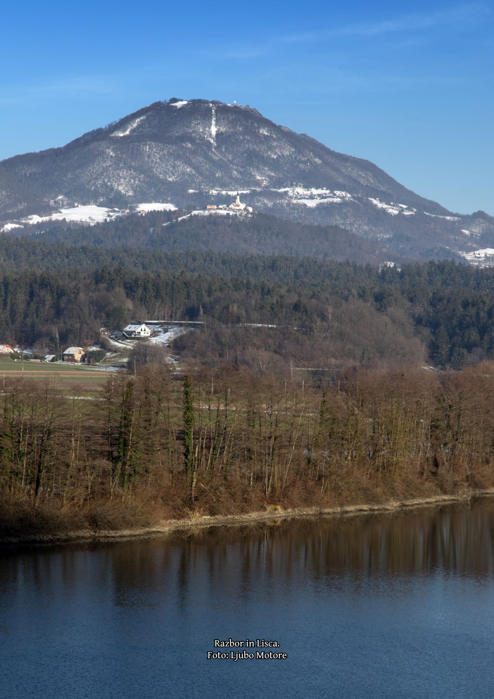
Razbor in Lisca.