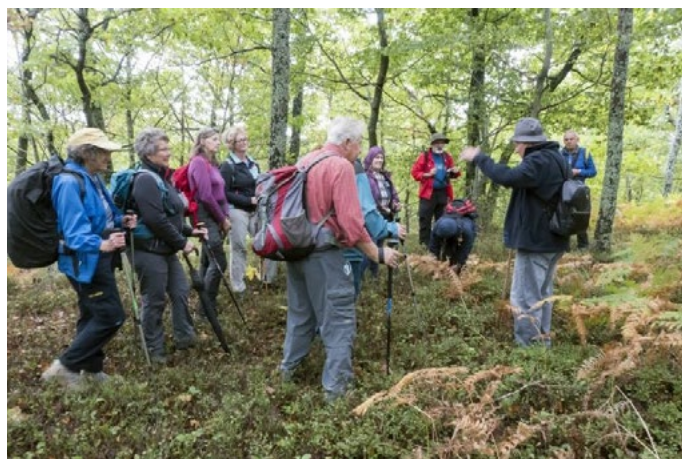
7. oktobra smo bili na Primožu.