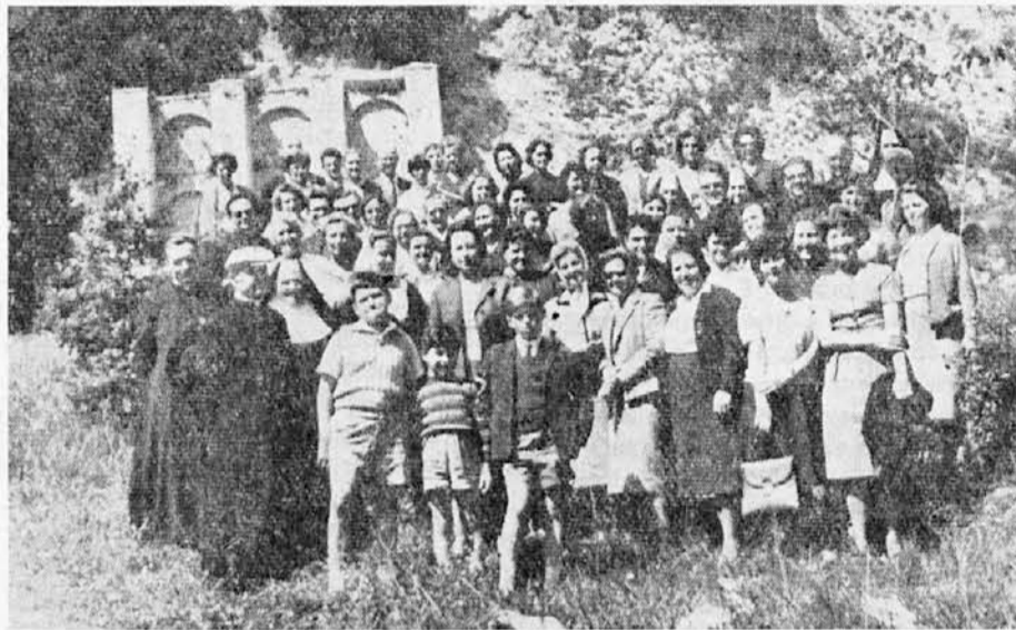
Skupina rimskih Slovencev na letnem izletu

Glavni nedostatek teh sestankov, ki ga je omenil že g. pridigar, se je pokazal takoj po zaključeni pobožnosti. Vsi, ki so se udeležili slovenskega izleta, o katerem smo tudi mi pisali, so z veseljem pričakovanjem čakali na skupinske fotografije s tega izleta. Ker izven cerkvice nimamo na razpolago nobenega prostora, so delili fotografije na stopnicah pred cerkvijo in na cesti med divjanjem avtomobilov in znanim ropotom velecestnega prometa. V takih okoliščinah ni mogoče noben razgovor in nobeno zblizanje. Velika večina