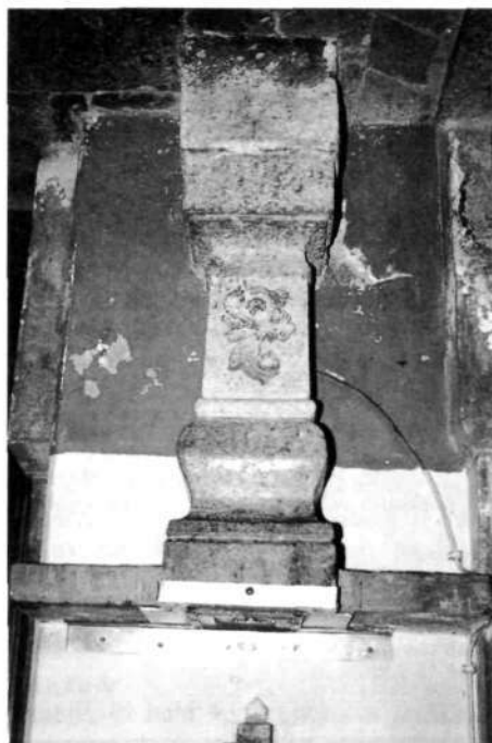
Nabiralnik za darove na levi strani pred-dverja