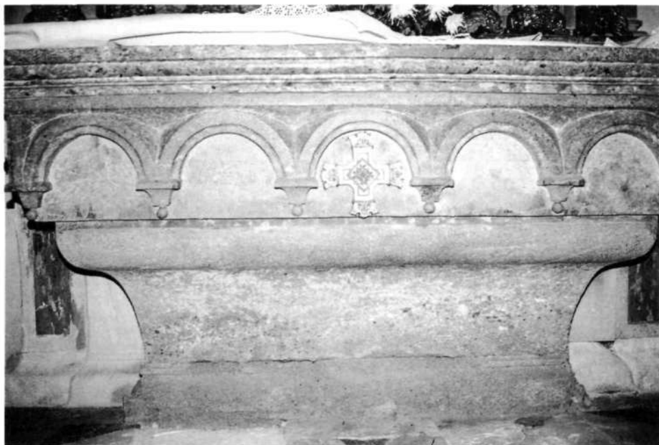
Desni stranski mali oltar z vbočenim podstavkom, petimi vdolbenimi polji in križem v srednjem polju. Posebej izklesani vrhnji del menze je bogato profiliran in iz debelozrnatega konglomerata

Veliko kamnitničana je še pri šestih stranskih oltarjih, kjer se razkazuje v vseh šestih, po meter visokih menzah in 13 do 14 cm debelih ploščah pod tabernaklji in v spodnjem delu oltarjev. Menze štirih manjših oltarjev so enake in delo istega mojstra. Menzi večjih stranskih oltarjev se posebno v podstavkih ločita od menz drugih stranskih oltarjev, vse pa se razlikujejo od menze velikega oltarja. Pri manjših oltarjih je nad krajšim, navznoter vbočenim podstavkom menze in širšo ploščo nad njim zgornji del menze s petimi vklesanimi polkrožnimi nišami na sprednji strani in po eno