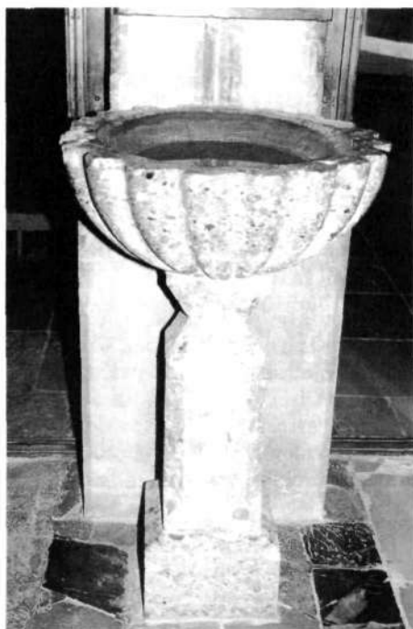
Kropilnik iz barvitnega debelozrnatega kamnitničana