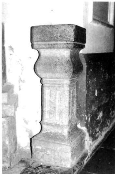
Nabiralnik za darove iz živo pisanega kamnitničana na levi strani ladje