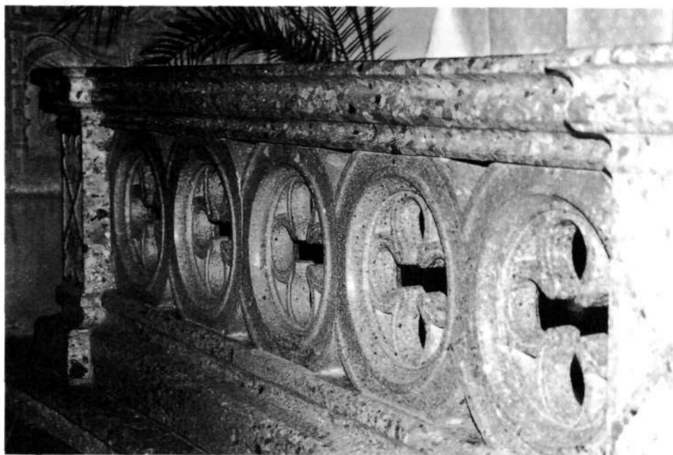
Desna polovica nekdanje obhajilne mize od nasprotne smeri

Razven mene se nikogar ni bal; vpričo mene res tudi nikoli nobene nespodobne besede ni črhnil, sicer pa ni bilo lahko lepe besede iz njegovih ust slišati; delal je le malo, večinoma je popival, kvantal in se rotil.