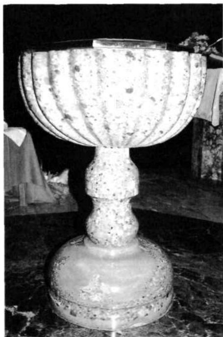
Krstni kamen, imeniten izdelek iz barvitnega kamnitničana. Na zadnji strani podstavka je spodaj vložek rdečkastorjavega drobnozrnatega apnenčevega peščenjaka, z zadnje strani

pritrjen križ, druge pa lepšajo rastlinski okraski. Zgornja stran menze je le grobo obdelana, druge pa večinoma uglajena. Kamnitničan je v menzi drobnejši pisan apnenčev konglomerat, ki mu nekoliko debelejši prodniki in različni barvni odtenki poživljajo enoličnost.