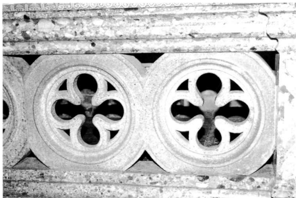
Rozeti iz rjavkasto rdečkastega drobnozrnatega kamnitničana med podstavkom, samo obhajilno mizo in stebričem iz debelozrnatega kamnitničana

Rozete so bile posebej izklesane in vstavljene v okvir, ki ga sestavlja še zgornji del obhajilne mize. Po dve in dve rozeti na straneh sta scela, srednja pa posebej isklesana in vstavljena v celoto. Izklesan je iz enega kosa, kar bogato profiliran, člani pa se od spodnjega proti vrhnjemu pasu širijo. Vrhnji najširši del enojne plošče je obhajilna miza v ožjem pomenu.