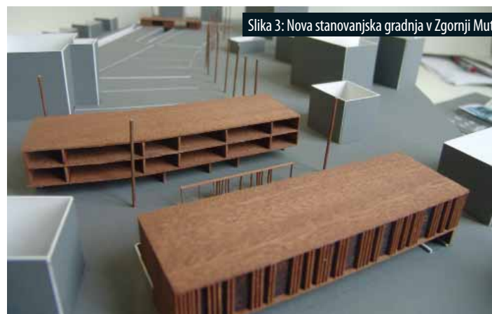
Slika 3: Nova stanovanjska gradnja v Zgornji Muti.