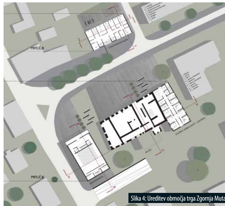
Slika 4: Ureditve območja trga Zgornja Muta.

In the workshop we tried to investigate the effects of spatial interventions to restructuring and changing of the image of three towns: Zgornja Muta, Spodnja Muta and Gortina. The regulations should primarily involve the building or organisation of the existing built fabric, particularly in the sense of renewal, revitalisation and reorganisation of these structures, with an emphasis on preservation of natural and cultural heritage qualities. In the 'Muta Workshop', the biggest emphasis was on the arrangement of market areas and connectivity among the towns.