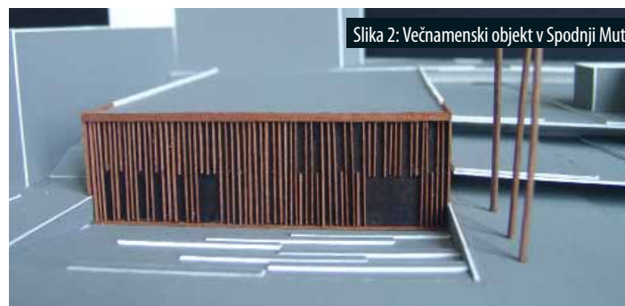
Slika 2: Večnamenski objekt v Spodnji Muti.