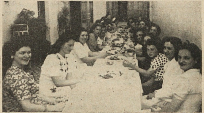
Las jóvenes reunidas en el Té