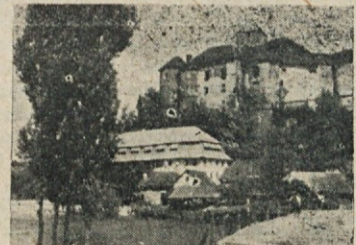
Žužemberk, uno de los centros de las guerrillas eslovenas.

JULIO 30. ("La Estrella de Londres"). La población es apresada y deportada, enviada a los trabajos forzados, encarcelada o puesta en campos de concentración. Así, la nación más pequeña del corazón de Europa sufre la prueba más terrible de su vida.