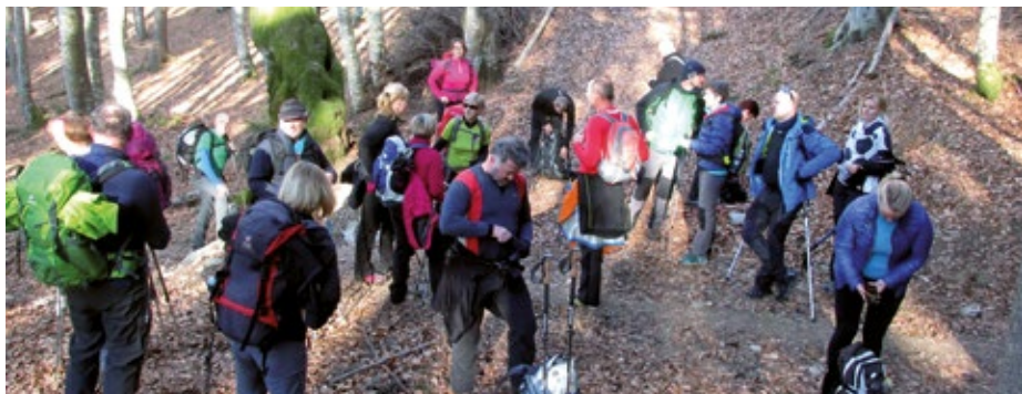
Postalo je vroče

dobro voljo in pozitivno naravnano-stjo ogreli premražene prste. Godba je zaigrala nekaj skladb, kar se kulturnemu dnevju pritiče, nato pa je naša skupina, ki je letos štela kar petindvajset pohodnikov, krenila na pot. Z vsakim prehojenim višinskim metrom nam je bilo topleje in ko smo iz senčne grape stopili na sonce, je že sledilo slačenje bund, kap in rokavic. Pot je bila suha in na debelo posuta z listjem, ki ga letošnja zima še ni predelala. Na najbolj osončenih delih gozda je že cvetel teloh in naznanjal, da pomlad nezadržno in zagotovo prihaja.