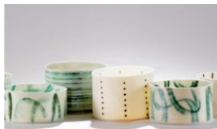
Keramika je končni izdelek iz gline kaolin.

glina je nizkotemperaturna glina, porcelan pa iz visokotemperaturne gline kaolin.