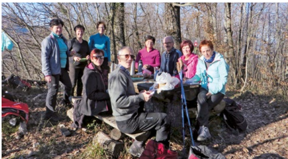
Zadovoljna družba pohodnikov DU Vodice na vrhu Velikaga Slomnika

Po jutranjem zboru v Vodicah smo se odpeljali do Celja in naprej proti Laškemu ter pri Košnici zapeljali z glavne ceste na veliko urejeno parkirišče. Tam smo zapustili vozila in naprej nadaljevali peš. Pot nas je kakšen kilometer daleč vodila po lokalni cesti do razpotja, kjer je odcep poti za Veliki Slomnik. Pot se je nekaj časa položno vila skozi gozd ob manjšem potočku, nato pa se je kmalu začela strmo vzpenjati. Dokaj hitro smo prišli do manjše počitniške hiše, ki so jo postavili visoko na strmem bregu nad grapo. Za to hišo se pot spremeni v dokaj strmo planinsko pot, ki preči reber do grebena, kjer se združi s potjo, ki pripelje pohodnike iz Košnice pri Celju. Od razpotja se pot v okljukih zmerno strmo vzpenja do samega vrha. Na vrhu, ki ni ravno razgleden, nas je sprejelo lepo sončno in toplo vreme ter miza s klopmi za prijeten piknik. Ne preveč zahteven vzpon, še zabavnejši spust v dolino in prijetna družba so lepo popestrili prvi letošnji pohod.