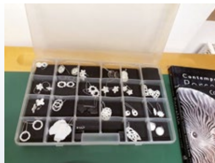
Predstavljajte si, da en kos vzame v roko vsaj 22-krat, preden je končan.