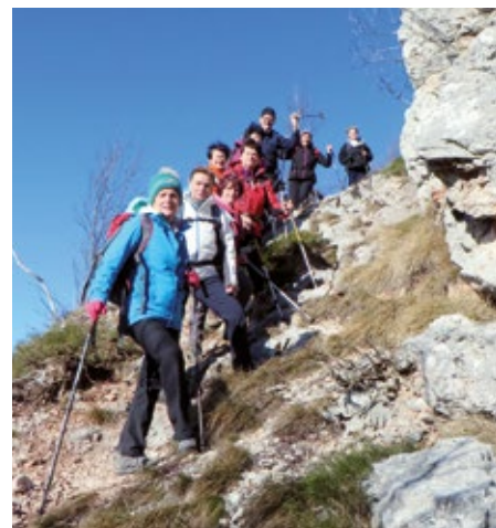
Spust z vrha Krvavice proti Zajčevi koči

Tudi naslednji pohod je predviden z obiskom primorskih hribov nad Hrastovljami.