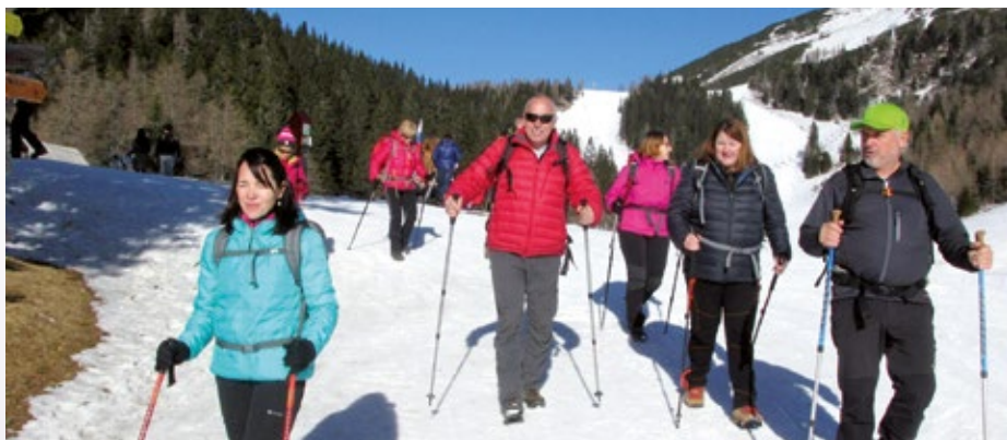
Nazaj v dolino

Začetek sezone je bil torej zelo obeta-ven in če se po jutru dan pozna, verjamem, da nas letos čaka zanimiva in bogata sezona, saj imamo v planu same zanimive in lepe vrhove.