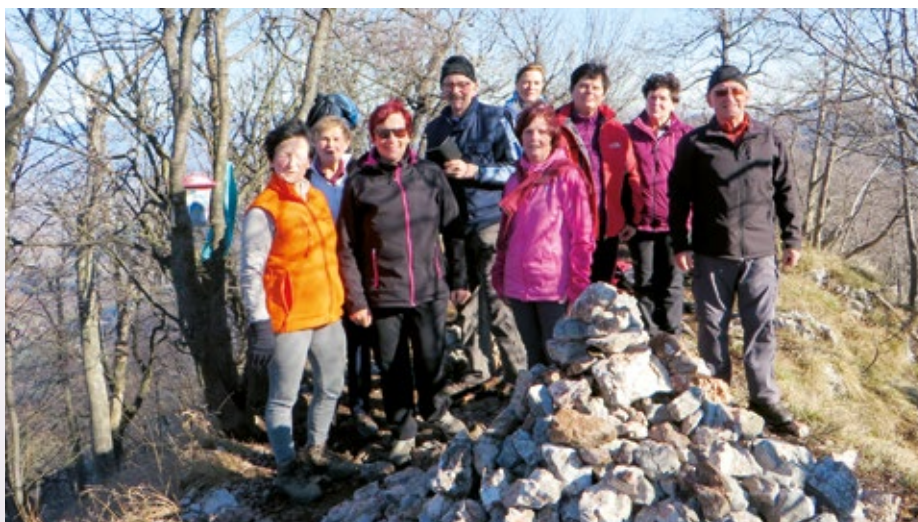
Pohodniki na vrhu Krvavice pri Menini planini

avtomobile. V gozd smo krenili po dobro uhojeni stezi, ki je tudi zgladno markirana. Pot je lepo speljana skozi gozd, dokaj napeta, vendar ne prestrma. Večkrat preseka gozdne ceste, vendar zaradi dobrih oznak nismo bili nikoli v dilemi, v katero smer kreniti. Pot vodi mimo kmetije visoko v hribih, za katero se priključi na makadamsko cesto, ki pa jo pri oznaki za Zajčovo kočico zapusti in se začne lahko spuščati. Po označeni poti smo prispeli do Zajčeve kočice, ki je bila zaprta, a kar lepo vzdrževana. Od