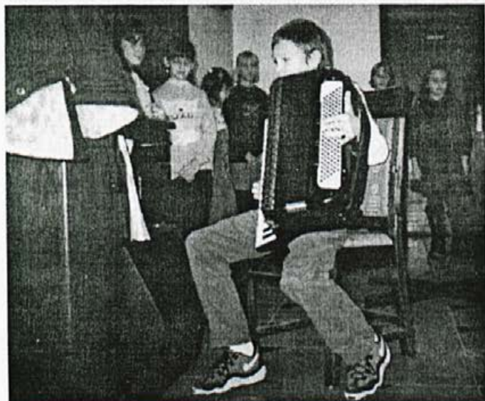
otroci med nastopom