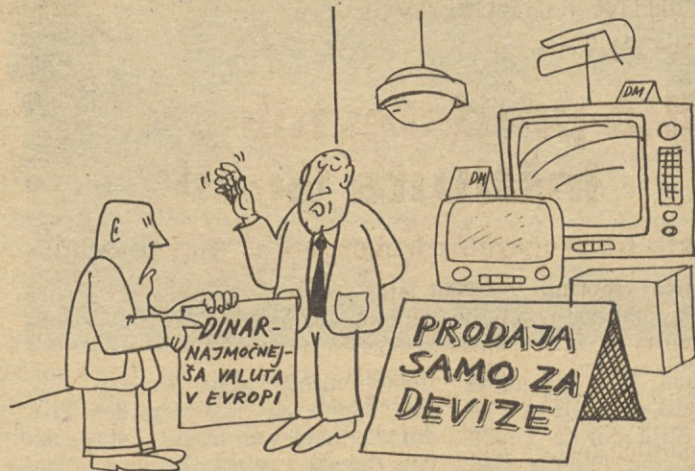
– Že mogoče, da je močan, ampak nas to ne zanima ...

Tekstilna stavka je bila velik uspeh partije v organizacijskem, še zlasti pa v političnem pogledu. (KONEC)