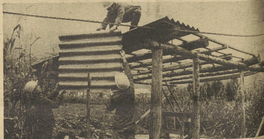
Kam spraviti pohištvo, pridelke, stroje, to je sedaj vprašanje, ki najbolj tare Breginjce. Čeprav vojaki in domačini zelo na hitro postavljajo barake, je tega še vedno premalo.