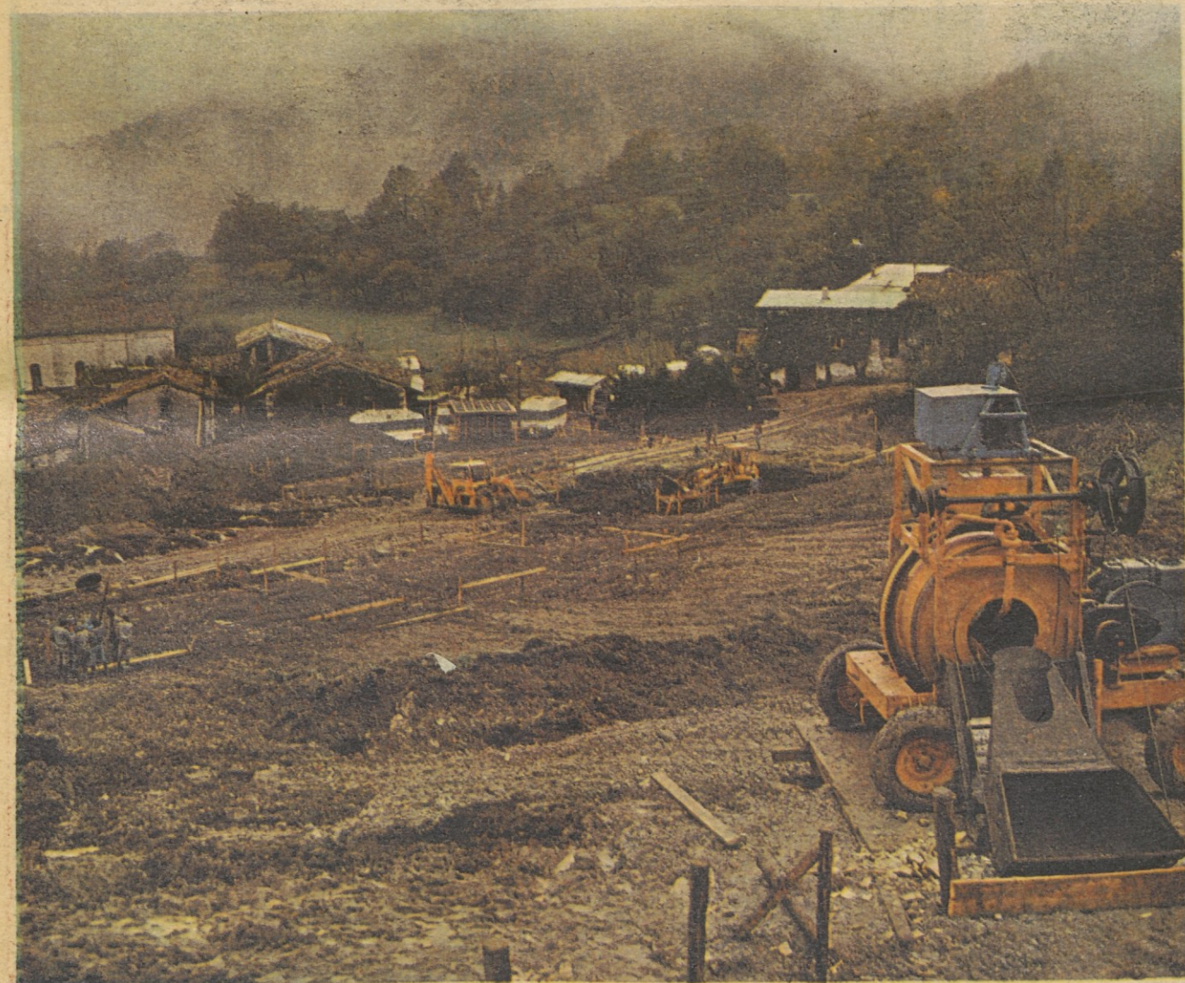
Deseti november, rok, do katerega morajo vsi prizadeti prebivalci dobiti streho nad glavo, je blizu.