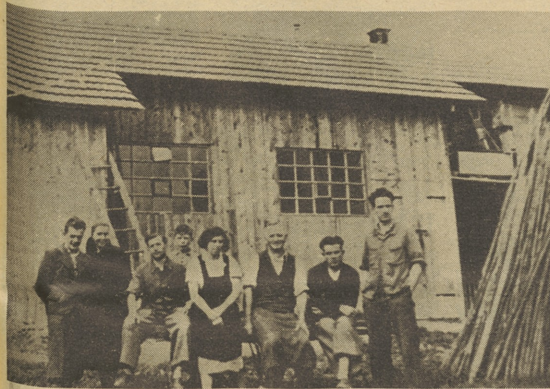
Tominčeva drvarnica v Stražišču pri Kranju, kjer je bila leta 1937 Tekstilna zadruga.

Stavkovni odbor, ki so ga dejansko vodili komunisti, se je dobro zavedal, da morajo Kranju slediti stavke v tekstilnih podjetjih vse Slovenije. Iz Kra-