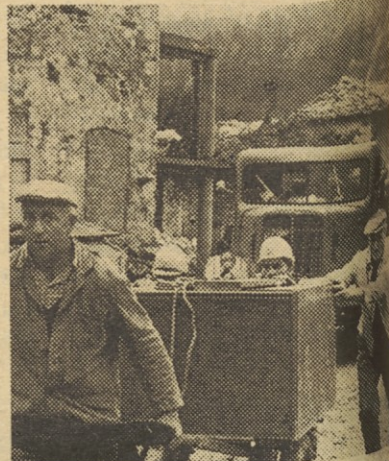
Največ težav pri rušenju imajo vojaki z izseljevanjem pohištva in imetja. Pogosto prenašajo pohištvo iz hiše v hišo, ker zasilnih barak še ni dovolj.