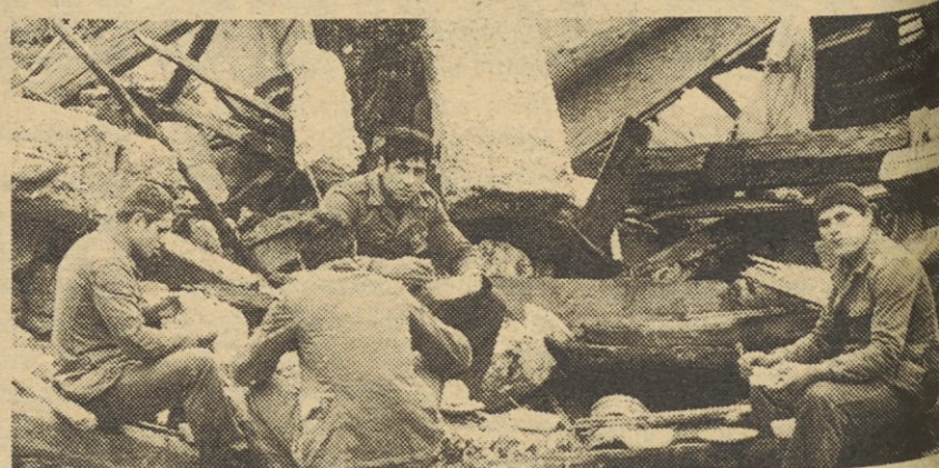
V Breginju ni jedilnice; vojakom tekne kosilo tudi med ruševinami.