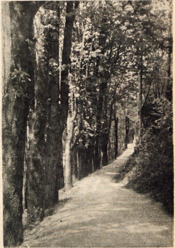
TAKO KOT JE GOZD VABLJIV V SEDANJIH, VROČIH DNEVIH, JE BIL PRIJETNO ZAVETIŠČE TUDI NAŠIM PRVOBORCEM

Ze ob tem bežnem pregledu lahko sklepamo, da bodo letošnje naloge družbenega plana izpolnjene in tudi presežene. Če bi primerjali še izpolnjevanje investicijskih nalog, ki potekajo mnogo bolj organizirano kot lani in vzporedno še uspehe v kmetijstvu in turizmu, ki že tudi kažeta velik napredek napram lanskemu letu — na Bledu je dneвно 200 do 250 ljudi več kot lani v istem času — bo celotno gospodarstvo kranjskega okraja napravilo velik korak naprej in ustvarilo ugodne pogoje za nadaljnji razvoj.