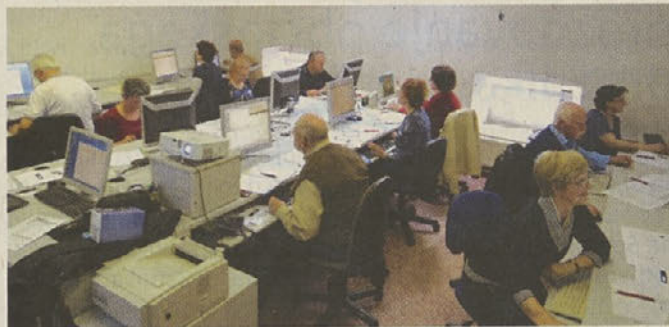
Učenje računalništva v tečaju RDO v Zagorju