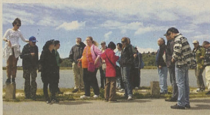
Skupina UŽU-MI iz društva ŠENT na ekskurziji

V juniju 2013 je bila preko omenjenega projekta organizirana strokovna ekskurzija za udeležence tretje skupine. Ogleдали smo si Piran – mesto doživetij, ki te očara – in Krajski park Sečoveljske soline. Soline so čaroben kraj, kjer se čas ustavi in pozabiš na vse.