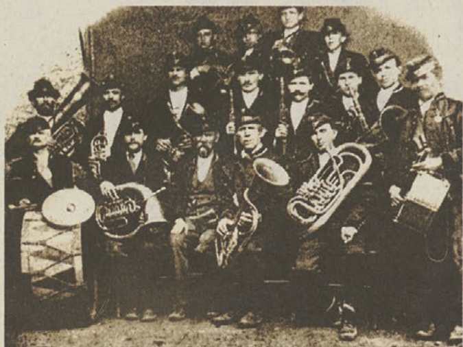
Slika 1: Godba leta 1868 na narodnem taboru v Žalcu