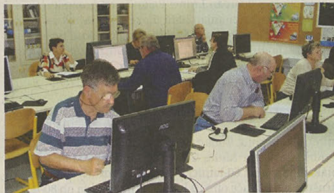
Učenje računalništva v tečaju RPO v Trbovljah

Druga oblika je bil 50-urni tečaj Računalniškega in digitalnega opismenjevanja. Vanj so se vključevali posamezniki, ki so delno že znali uporabljati računalnik in so želeli še nekaj več. Tečajniki so se naučili bolj zahtevne uporabe interneta, elektronske pošte in mobilnih aparatov. Seznanili so se s tabličnim računalnikom, e-upravo in programom za urejanje digitalnih fotografij.