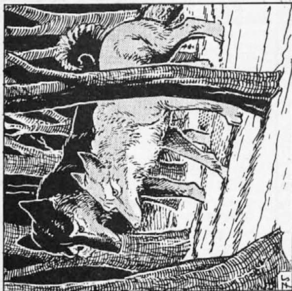
75. Počakal je, da ga je dohitela. Nežno se mu je približala in Kazan je vzdrhtel ob pogledu njenih vdanih oči. Približala se mu je in začela lizati njegove globoke rane. Kazan se je kljub bolečinam ponosno vzravnal. Ni bil več sam! Bil je zmagovallec in novi vodnik, našel je družico, našel je Sivo! Ponosno jo je odvedel v gozd.