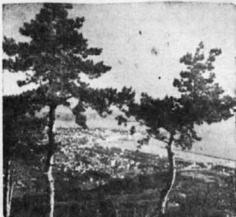
Motiv s Tržaškega

Velika papirnica na Švedskem je začela izdelovati posteljno perilo iz papirja. Ne samo rjuh, ampak tudi pregrinjala in blazinske prevleke; te pripravljajo iz mehkega krep-papirja, ki vzdrži tudi tri mesece. Posteljno perilo iz papirja je zelo primerno zlasti za hotele in bolnišnice, ker se po uporabi lahko zavrže. Cene za eno popolno posteljno opremo so tudi tako nizke, da zadostuje oprema le za enkratno uporabo. Na trg so že vrgli velike množine papirnih rjuh in pregrinjaj po 300 lir.