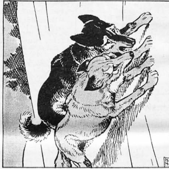
77. V naslednjih dneh sta se Kazan in Siva še bolj zblížala. Kazanu je nova družica vedno bolj ugajala. Imel jo je rad, tako rad, kakor samo še eno bitje na svetu. Izabelo, svojo gospodarico. Večkrat se je ob Sivinem ljubkovanju spomnil njenega božanja in Siva ni vedela, zakaj je v takih trenutkih dvigal glavo in žalostno cvlil.