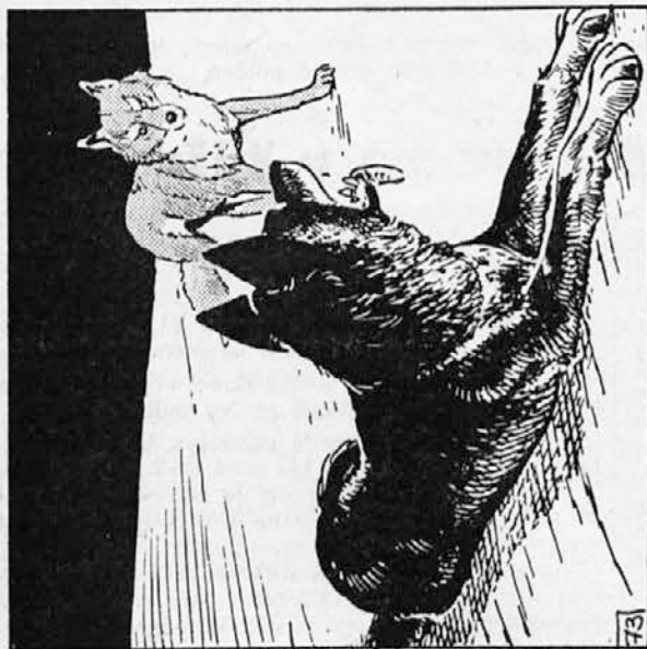
73. Kazan je dvakrat obkrožil krdelo, potem pa je legel v sneg, da si odpoeije od boja. Takrat je zagledal, da se mu počasi bliža mlada, vitka volkulja. Gledala ga je in vohala njegove rane. Nežno je zacvivila. Bila je krasna mlada žival. V mesečini se je njena voljna dlaka svilenno lesketala. Legla je k njemu in mu položila glavo na hrbet.