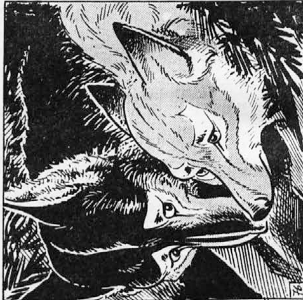
76. Tisto noč sta Kazan in Siva našla prenciče v gosti goščavi smrek in balzamovec na mehki progi suhih smrekovih igel. Siva se je stisnila k njemu in mu znova lizala rane. Začelo je snežiti, toda v njuno zavetje snežinke niso našle poti. Na slednji dan sta skupaj tekala po zasneženi planjavi. Zvečer pa sta skupaj lovila ob jezuru.