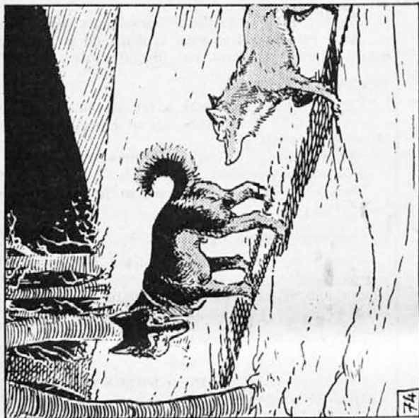
74. V Kazanu je vstajal ponos. Vedel je, da bodo odslej volkovi v krdelu poslušali njegov glas, poziv zmagovalca! Pa še neko drugo čustvo se je prebudilo v njem, ko je gledal mlado volkuljo. Dvignil se je in odšel proti goščavi, da bi se na samem odpočil. Ko pa se je enkrat ozrl k volkovom, je videl, da mu mlada volkulja sledi.