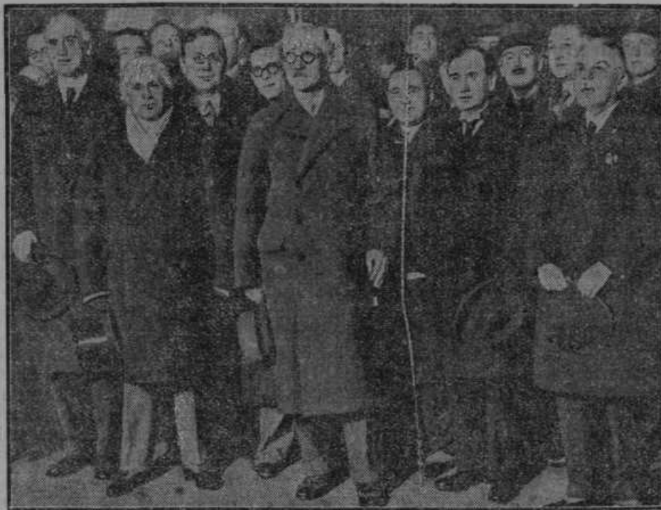
Angleško-francoski razgovori v Parizu. Od leve: Simon, angleški zunanji minister; Pavel Boncour, francoski zunanji minister; Macdonald, angleški ministrski predsednik; Daladier, francoski ministrski predsednik; lord Tyrell, angleški poslanik v Parizu.

no sv. mašo. Navzočim članicam Marijine družbe in članicam Marijinega vrtca je priporočal, naj izpolnijo 4. božjo zapoved, ki zagotavlja dolgo življenje. Njemu je Bog resnično izpolnil svojo obljubo, ker je staršem vedno izkazoval ljubezen in spoštovanje.