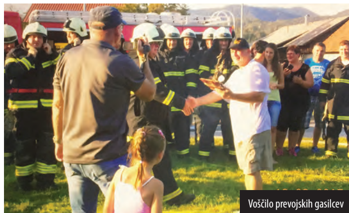
Voščilo prevojskih gasilcev