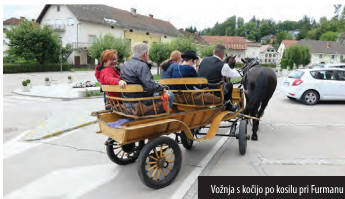
Vožnja s kočijo po kosilu pri Furmanu