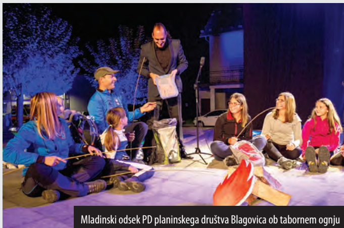
Mladinski odsek PD planinskega društva Blagovica ob tabornem ognju