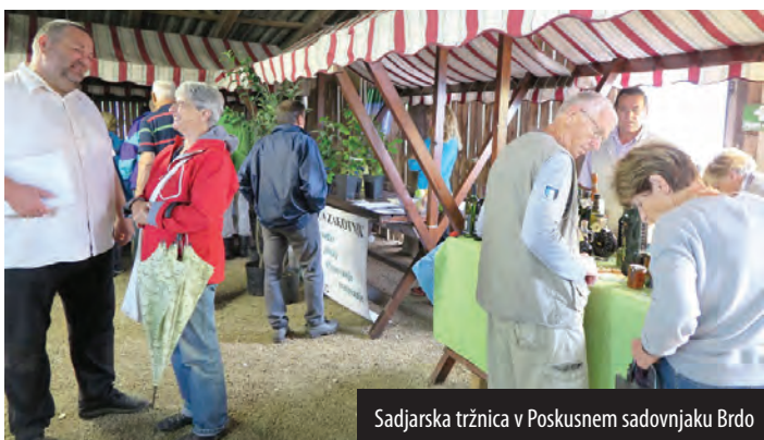
Sadjarska tržnica v Poskusnem sadovnjaku Brdo