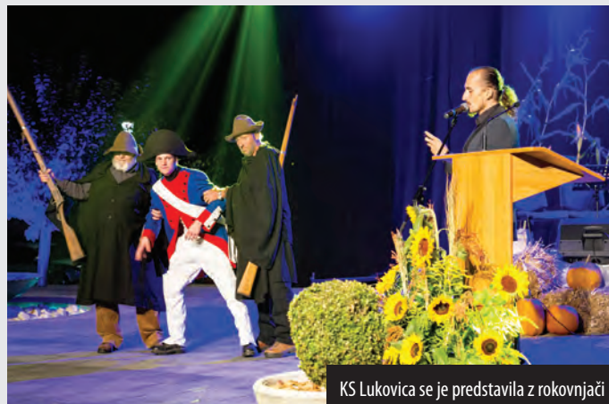
KS Lukovica se je predstavila z rokovnjači