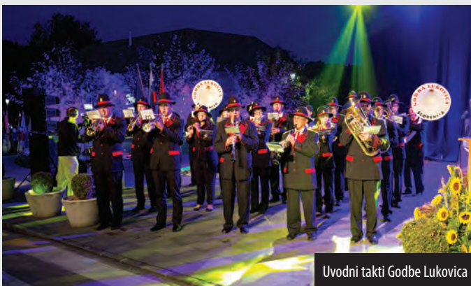
Uvodni takti Godbe Lukovica