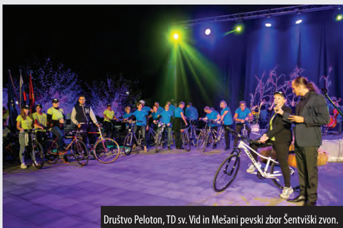
Društvo Peloton, TD sv. Vid in Mešani pevski zbor Šentviški zvon.