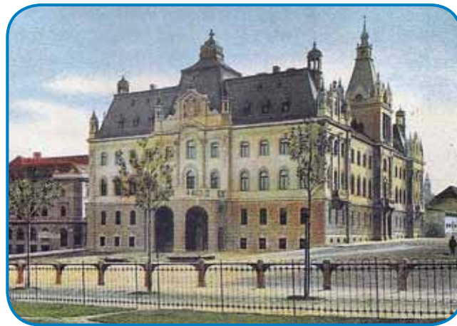
Podoba kranjskega deželnega dvorca, preden je leta 1919 postal sedež Univerze v Ljubljani