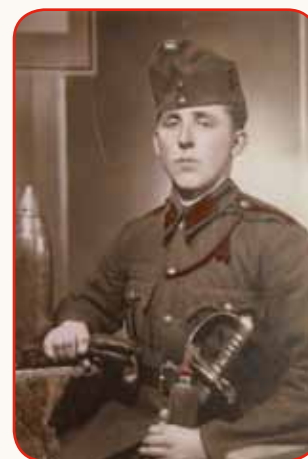
VSIKŠI JE SVOJE KARTE V ŽEPKO DJAU stran 8