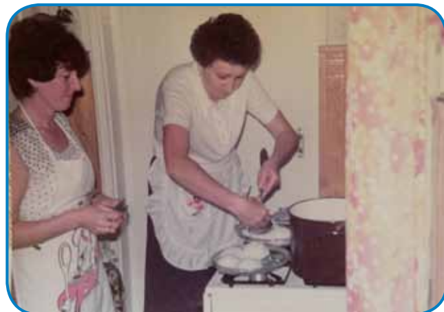
Ani pa Margit Čer küjata za gostúvanje

»Bilau, vino, šör, vse, ka so doma redli, te je piti v bauta ništje nej tjöjpo. Vsakši emo lugaš, gde so grauzdje pauva-