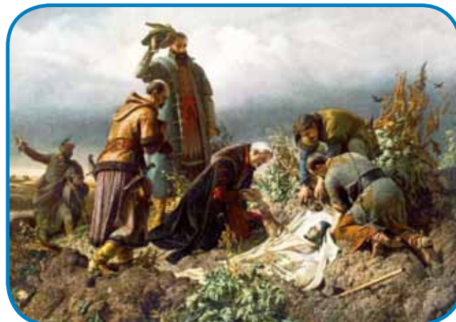
Na kejpi Bertalana Székelya (1860) vidimo, kak so najšli mrtvo tejljo mladoga krala Lajoša II.

protivnikom. Bitka je trpela samo edno vöro pa pau, končala se je katastrofalno - kak liki tista pri vesi Muhi leta 1241. Spadnilo je dosta sodacki prejdjov ino kauli 10 gezero sodakov, mladi krau Lajoš II. se je zalejo v potoki Csele, gda je sto na svojom konji vkrajzbejžati. Ali bi se leko ovak zgaudilo? Čednjaki pravijo, ka zavolo dosta vekše mauči Osmanov nej. Katastrofa pa bi nej tak