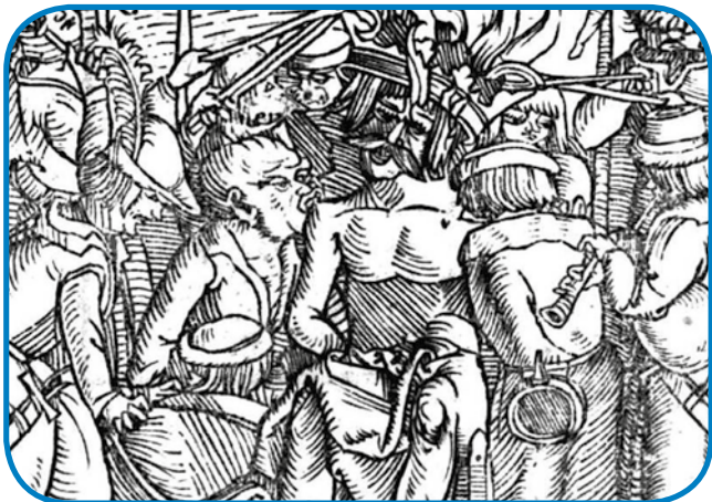
Vlovljeni pavri so mogli gristi mesau svojoga »krala« Györgya Dózsa

Krau Matjaš Hunyadi je nej od svoje prve, nej od drüge žené nej emo mlajše. V slejdnji lejtaj svojoga žitka se je trüdo, ka bi vogrski tronuš erbo njegov nezakonski sin od edne avstrijske varašanke János Corvin . Imenuvo ga je za grofa pa kneza, dau ma je veuke grünte, depa po njeg-