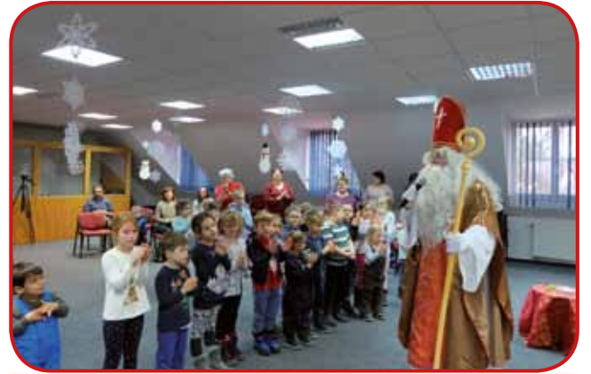
»Ali ste bili pridni?« je vprašal otroke sveti Miklavž

ralska praznike preživeti sama. A letos se zgodi čudež, saj