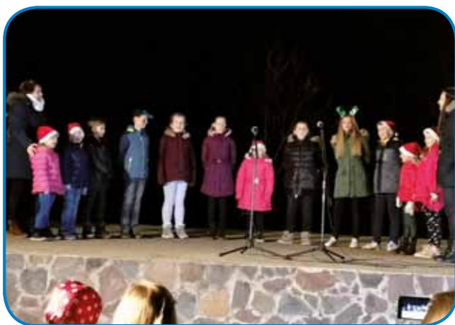
Seniške sinice so pokazale, ka ne vejo samo slovenski, liki engliški tö spejvati

Po dvojezičnom programi najmenjši Senčarov je rejsan prišo pravi Miklauš. Vse navzauče mlajše je dobri starček čako na oder, gde je vsikšoma kaj za dar dau. Organizatorge pa so vözraščenim ponüdili topeu čaj pa reteše - depa fajno küjano vino se je tö natakalo. »Vsi tü živemo v našoj vesi, generacije morejo vküper delati. Aj starejši vidijo, ka mladi znajo, mladi pa aj vidijo, kakše šege, navade ohranjajo starejši. Radi bi bili, ka bi naš adventni program uni nadaljevali. Leko, ka kaj ovak vözmisljijo, depa aj ves donk vküppride,« je za