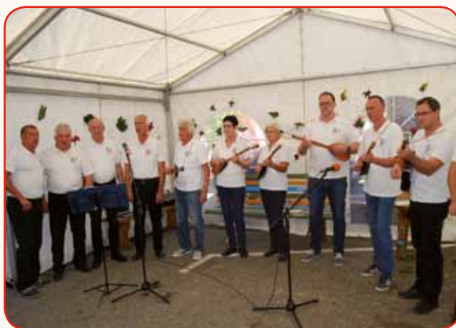
DVESTO MLAJŠOV JE NAVČO ŠPILATI NA TAMBURICO stran 6