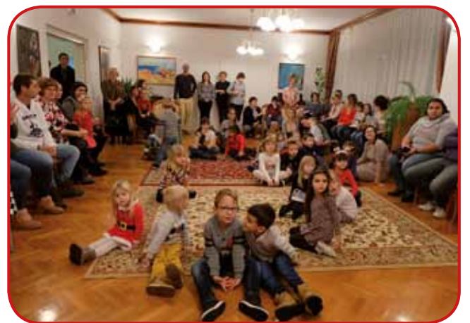
Malčki in starši so napolnili sejno sobo konzulata

vanovič, ki je otrokom pripovedovala pravljico o začarani in v ledeni grad zaprti princeski, ki jo reši beli medved, ki postane po poljubu na smrček lepi mladi princ in ostane s princesko v ledenem gradu.