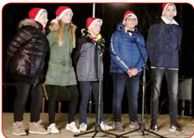
»... PSMICE SE VČILI, TE RAZVESELILI ...« stran 3