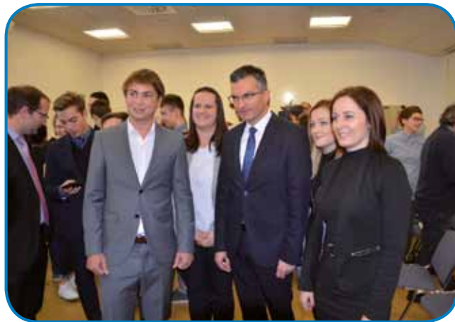
Porabci s predsednikom vlade Marjanom Šarcem

Prireditve se je udeležilo več kot 100 mladih iz zamejstva. To dokazuje, kako pomembno je povezovanje mladih v alpsko-jadranski regiji. Mladi so prišli z avstrijske Koroške, iz Kanalske doline, Benečije in Trsta, iz Gorskega Kotarja in Reke ter iz Porabja. Na srečanju so bili prisotni tudi predstavniki zamejskih