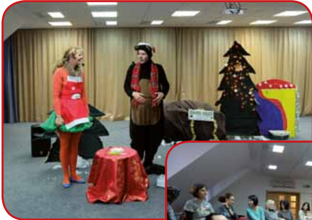
Nežka in Medonjam (Miškino gledališče) v igri Medeni čudež na Gozdni ulici 1A

da so bili pridni. Malčki iz posameznih vrtcev so Miklavžu zapeli ali recitirali razne pesmice, nakar so dobili darila z različnimi sladkarijami. Z