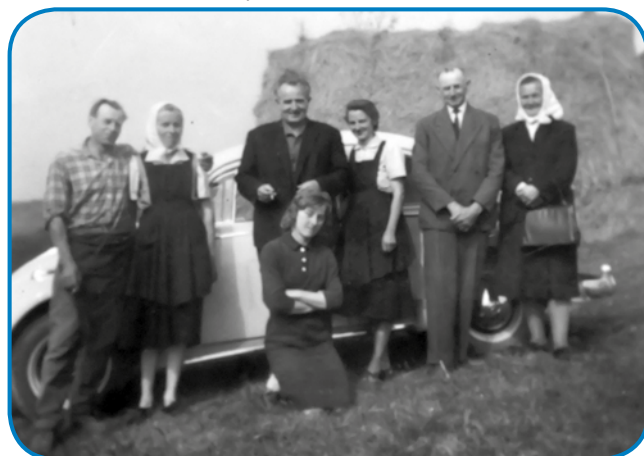
Andovčani z dolenskim župnikom pred njegovim fičojem

Kürnjek, zato ka gnauksvejta skur cejla zemlé, ka so v Andovci bile, so te dvej dru-