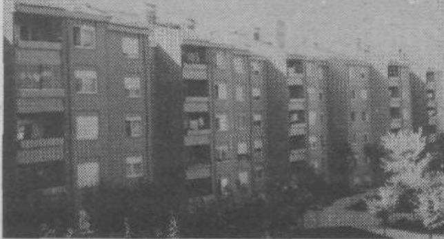
Poznojesensko popoldne.