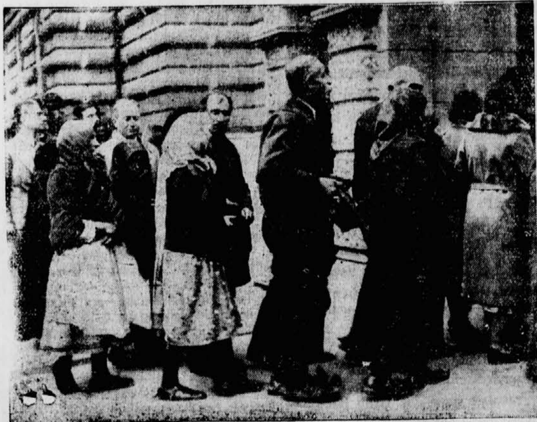
Ein ergreifendes Bild, das Leute aller Stände vor dem königlichen Schloß in Beograd zeigt, die ihrem toten König den letzten Besuch abstatten wollen.