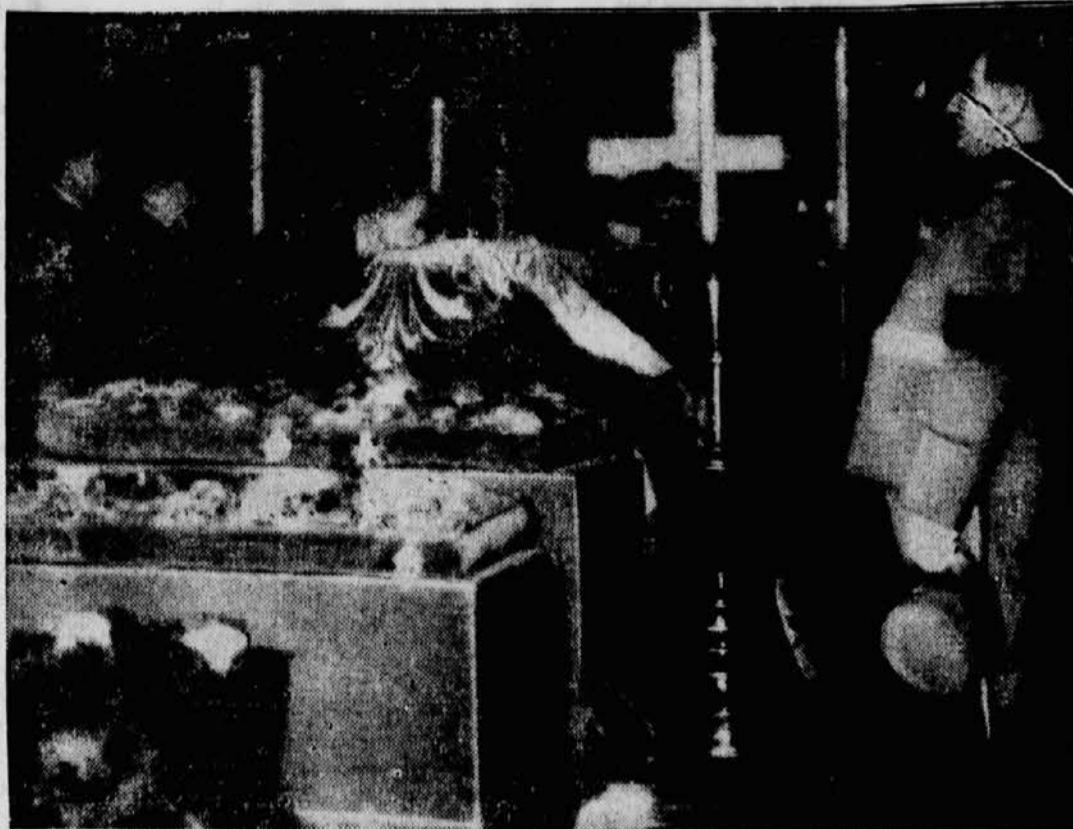
Im königlichen Schloß in Beograd zogen Stunde um Stunde Hunderttausende am Sarg des toten Königs vorüber, und viele küßten in ehrfurchtsvoller Ergriffenheit den Sarg, dessen Aufbahrung im Schloß unser Bild zeigt.

Die Fahrt ging durch die landschaftlich so reizvolle, diesmal unter einem düsteren Himmel dahingestrente Sumadija. Nur wenige Kilometer ist die lange Autokolonne noch entfernt von der letzten Ruhestätte der Mitglieder des königlichen Geschlechtes, der Karadjordjevic. Plötzlich erklingen der Karadjordjevic, die Glocken von Topola. Kanonendonner und das brausen der schweren Flugzeugmotoren lassen erkennen, daß die Beisetzungsfeier sich ihrem Höhepunkte naht. Von Topola bis Oplenac bildet die Wehrmacht dem toten König ein letztes Spalier. Das Volk von Topola ist zunächst wie erstarrt. Die Starre löst sich beim Erscheinen des jungen Königs und seines hohen Gefolges. Nun dröhnen immer wieder die Aufse: Es