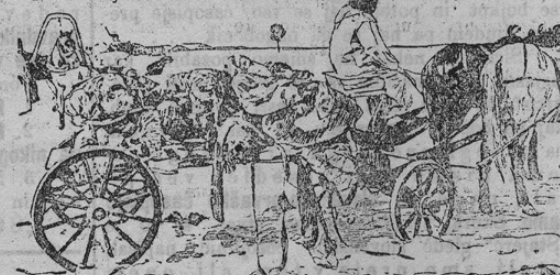
Photographische Aufnahmen von der Pest in China

vili grozno bolezen in ji zlasti pot v evropske države onemogočili.