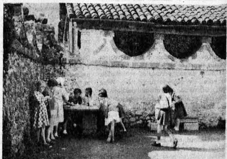
V koloniji »Stokad« v Paularu v avgustu 1958