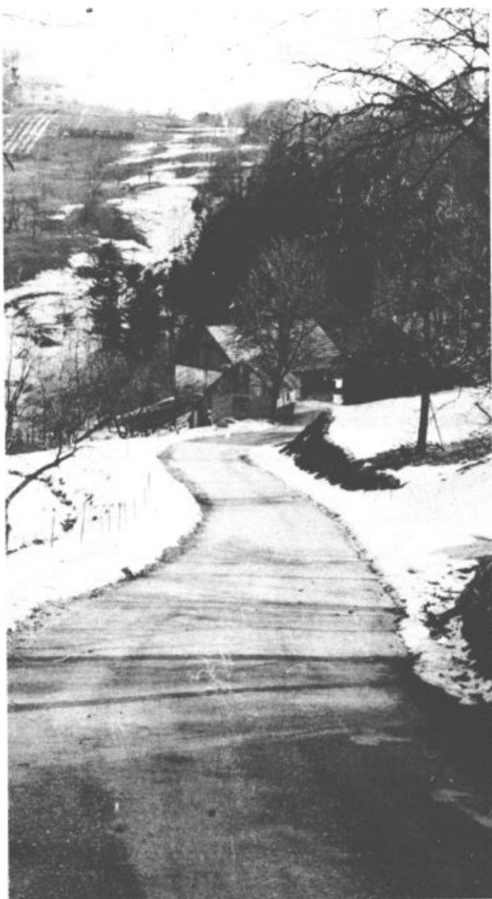
Urejene ceste so največja pridobitev