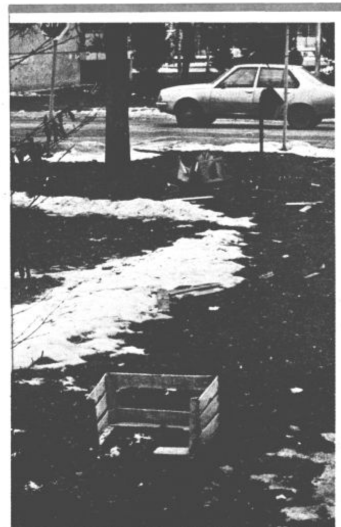
Nastopila je odjuga in ostale so le krpe snega, pa tudi »lepos okolje. Posnetek smo napravili med Kidričevo in Prešernovo cesto v Velenju

SKUPŠČINA OBČINE VELENJE — ODBLEK ZA FINANCE