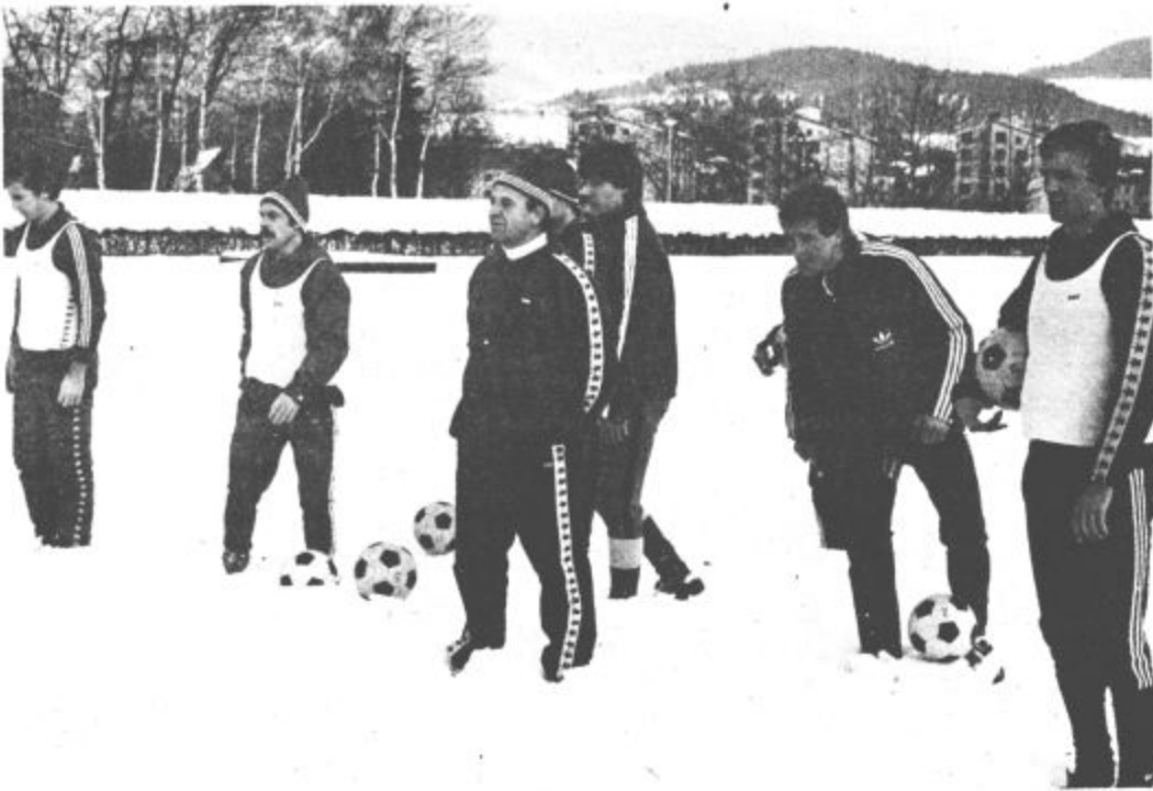
Na Ravnah so trenirali še po snegu

Priloge nogometišev Rudarja so v polnem teku. Sprva so načrtovali, da bodo trenirali deset dni v Velenju in nato odšli približno za prav toliko dni v Podvin na Gorenjsko.