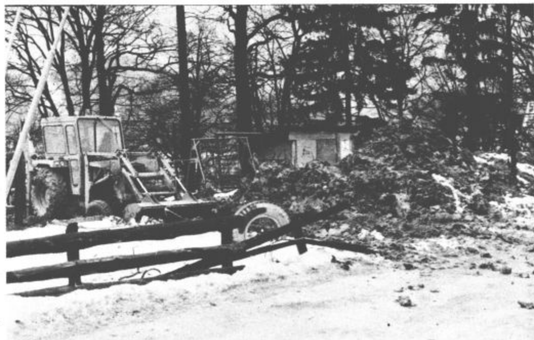
Glavna investicija je bila toplifikacija krajevne skupnosti

Predsednik skupščine krajevne skupnosti Velenje — Šmartno Pane Semečnik: „Akcijski dinar na dinar je bila velika spodbuda. Nov samoprispevek pa odpira tudi nove možnosti.“