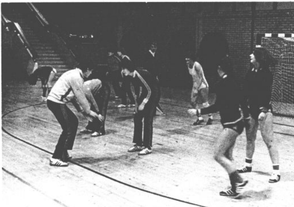
Med treningom v Rdeči dvorani