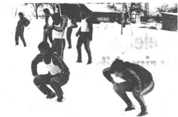
S priprav v Velenju