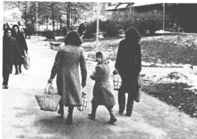
Običajnemu vsakodnevemu pozdravu je pred dnevi sledil tudi »do-datek«: pohite, pohite. Prašek so dobili. Tisti, ki so pohiteli in nekaj časa stali v vrsti, so vrečko tudi dobili. Drugi, ki so bili bolj počasni ali pa se jim ni ljubilo dolgo čakati pa bodo prišli na vrsto drugič

Družinska stanovanja za izvršitelje pod tč. 2, 3, 4 in 5 so zagotovljena. Prijava z dokazili o izpolnjevanju razpisnih pogojev pošljite na naslov: Združene zdravstvene organizacije Velenje, DSSS, Velenje, Vodnikova 1, pod 1 z oznako »za razpisno komisijo« v roku 15 dni po objavi.