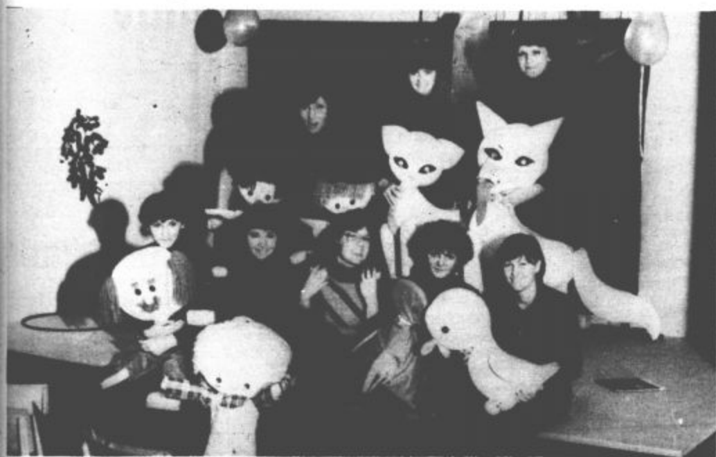
Za lutkarstvo vedno več zanimanja