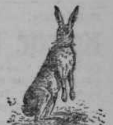
Zajec: 6—10 let