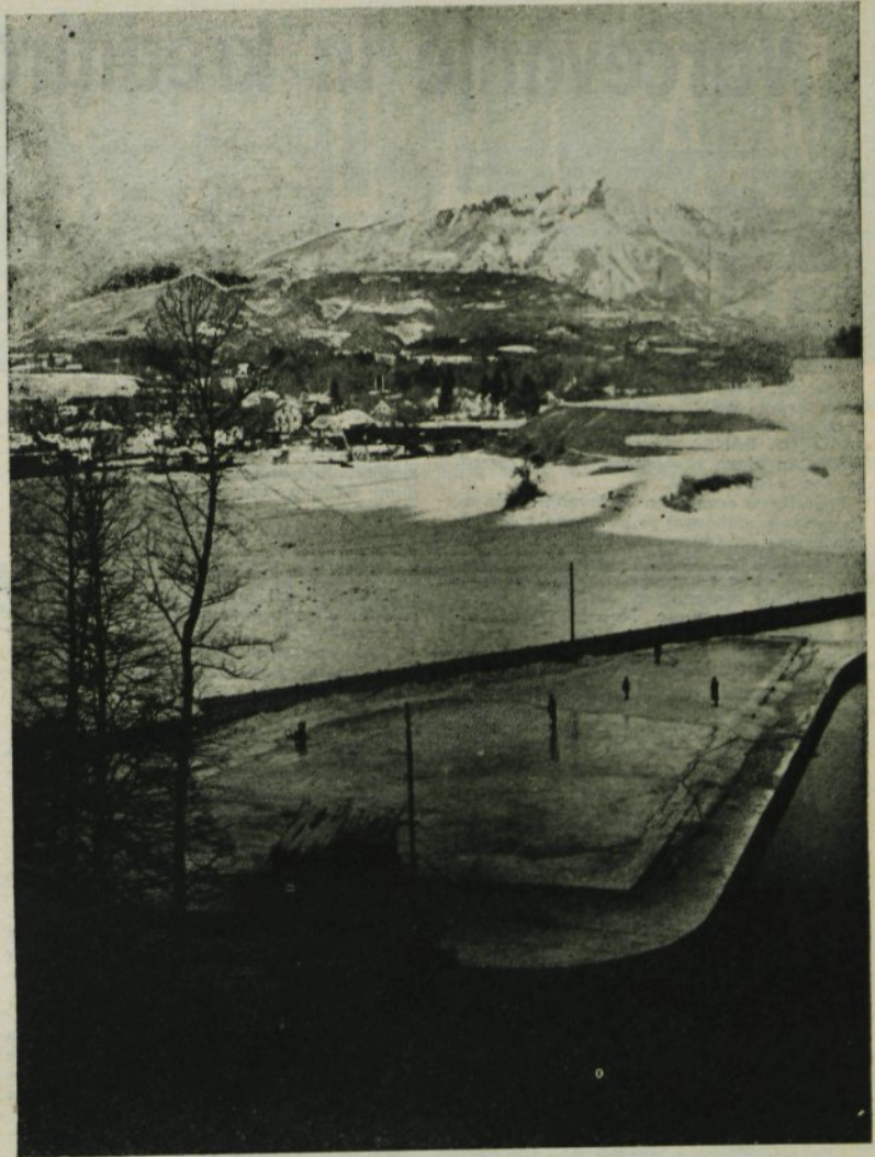
Kamniško drsališče poleg kopališča, kakor je izgledalo januarja leta 1931 — še pred prvo hokej tekmo v državi.