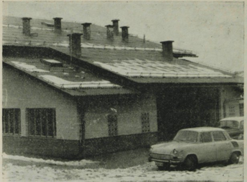
Novo šola v Tunjicah, ki je bila odprta pred dvema mesecema