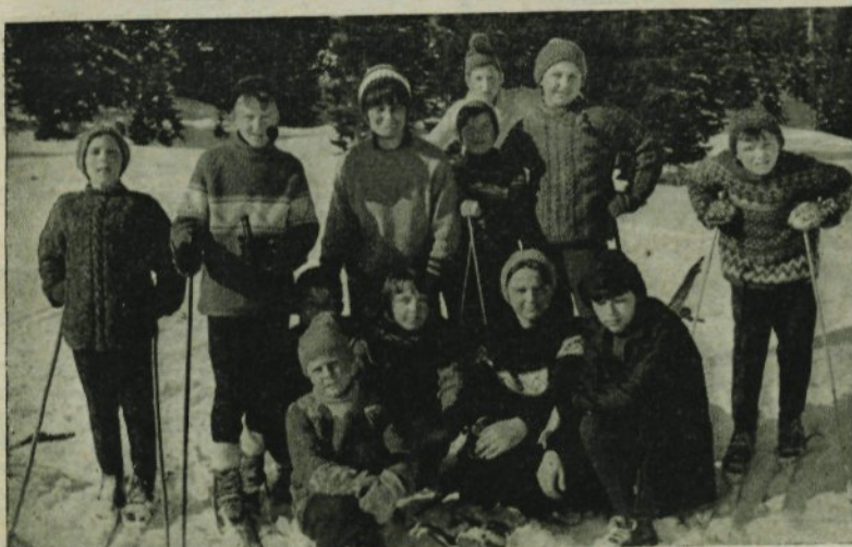
Skupina tečajnikov osnovne šole »Toma Brejca« na Veliki planini