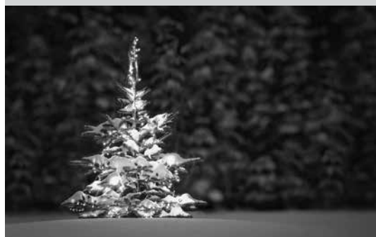
Sliki 7, 8: Izziv božičnega drevesa je to, da premaga svoje hrepenenje po drugem, boljšem okolju. Živeti mora tam, kjer ga cenijo in sprejemajo.

cenijo tisto, kar so v življenju dosegli, kar že imajo. Naj jih ne vodijo velika pričakovanja. Božično drevo je hrepenelo po božanskih razmerah, kjer bi lahko uresničilo sebe, vendar je prepozno prepoznalo resnične razmere in svoje zmožnosti. Harmonijo je prepoznalo šele takrat, ko je ta izginila in je ni imelo več. Spoštovali so ga samo tam, kjer je odraščalo – v gozdu –, kasneje pa ni imelo več možnosti za uspeh. Ključno vprašanje je v tej pravljici je tudi: Kaj je sreča? Sreča ni končni cilj, ampak morda pot do njega.