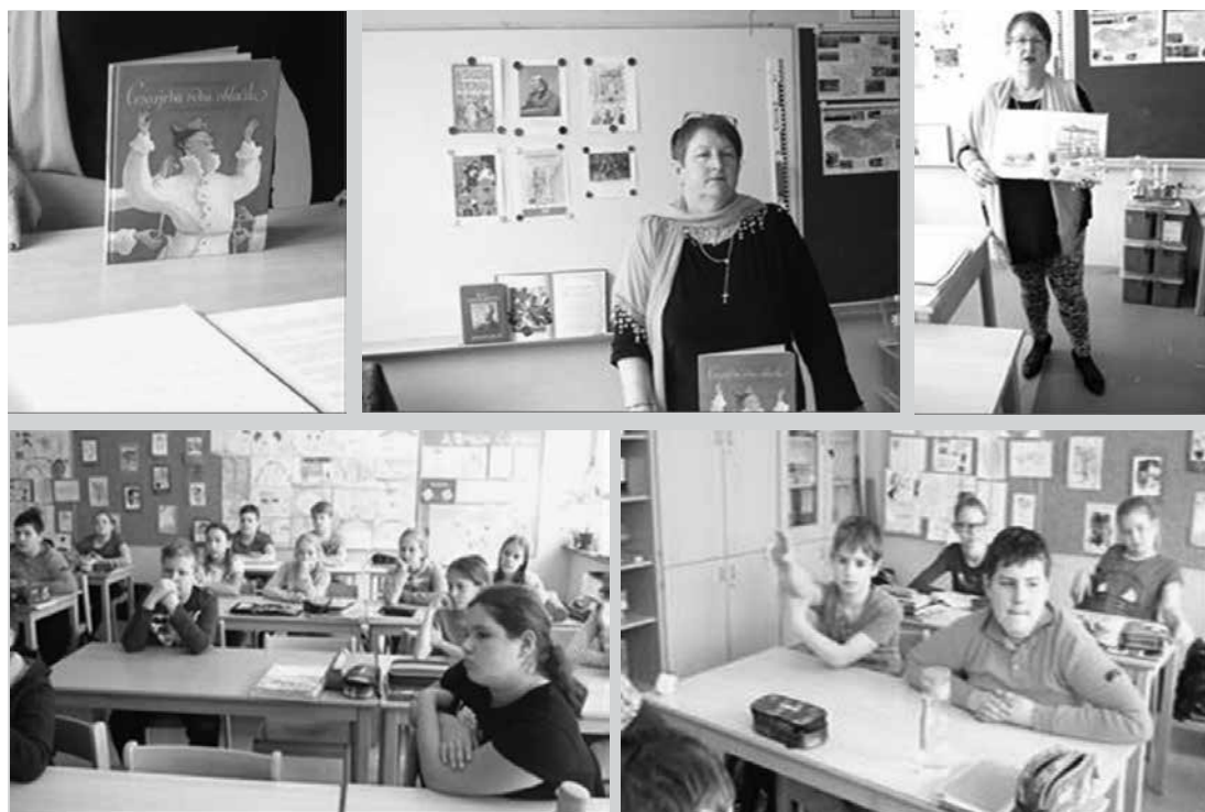
Slike 9, 10, 11, 12, 13: Izvajanje biblioterapije s pomočjo Andersenove pravljice z naslovom Cesarjeva nova oblačila v okviru bibliopedagoških ur na Dvojezični osnovni šoli I v Lendavi

Terapevtsko branje ali biblioterapija je v zgodnjem svetu nekaj običajnega, pri nas pa,