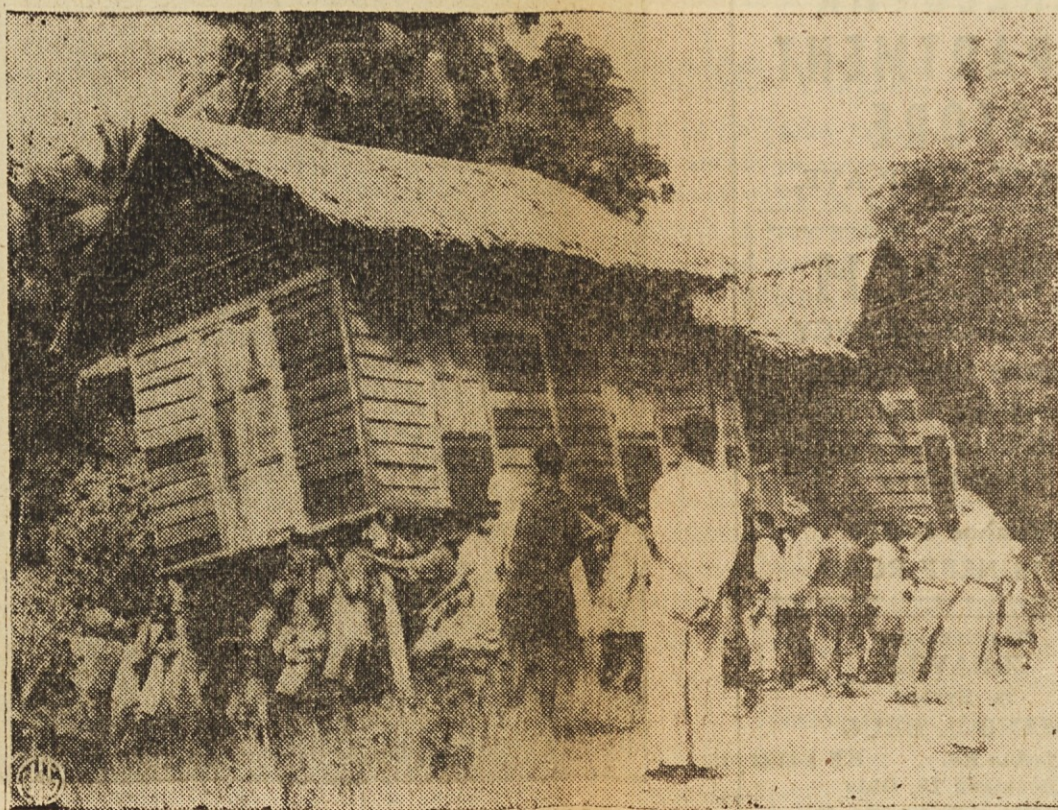
HISO SELIJO NA — MALAJI — Pri nas se včasih dogodi, da kako hišo preselijo, oziroma prepeljejo na drugo mesto, na Malaji, kjer hiše niso tako težke, pa jih enostavno preneso. Na sliki vidimo tako selitev, pri kateri sodeluje okoli 200 mož.

Hiša naprodaj Enostanovanjska hiša z osmimi sobami je naprodaj v Nottingham. Velik prostor na oglu 60 x 160. Ogled samo po dogovoru. Kličite IV 1-4959 med 7. in 9. zv. —(161)