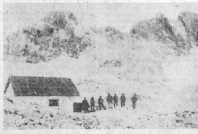
Prva planinska koča pod Triglavom