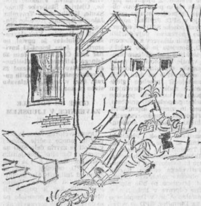
— Poberi se pod stopnice. Ne želim nobenih skrbi zaradi vikenda!...

den sem se podal v kraljevstvo sanj. Kdor koli je že bil, v Turčijo ga gotovo še nikoli ni zanesla pot, da bi se lahko prepričal, kako je tujec lahko sprejet pri domačinih. Drugo jutro naju je eden izmed bratov z vozom odpeljal do nekaj kilometrov oddaljene ceste. Zapravljuvček, kakor bi mu pri nas rekli, se je pozibaval po prašnem kolovozu. Opazoval sem štorčlje, ki so stale ob poti in nas dostojanstveno opazovale. (Se nadaljuje)