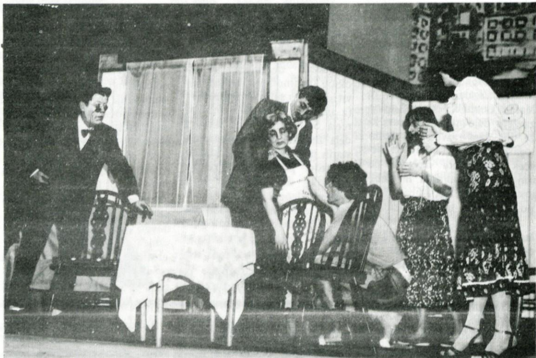
Prizor iz Gervaisove komedije „Zaradi stanovanja“