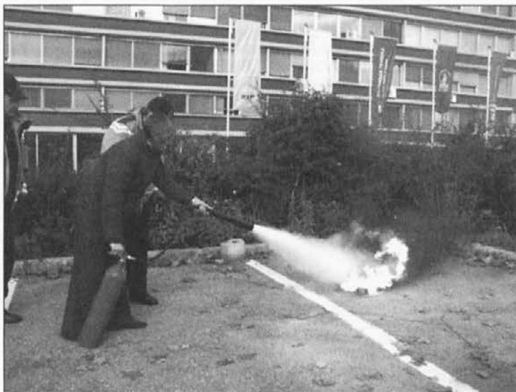
Začetni požar je mogoče s pravilnim pristopom uspešno pogasiti.