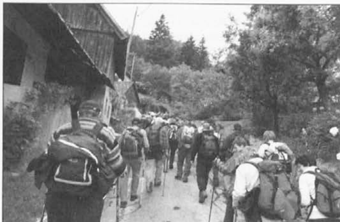
Utrinka s pohoda na Dovško Babo

»Ob pregledu našega planinskega pohodništva lahko z mirno vestjo ugotovimo, da svoje poslanstvo, ki smo ga prevzeli pred leti, opravljamo zadovoljivo, vztrajno in dokaj uspešno. Premagali smo mnoge ovire, spremljane z viharji, spet širimo idejo pohodništva s pomočjo nekaterih vrlih in trdnih mož,« je dejal starosta planinskih vodnikov in