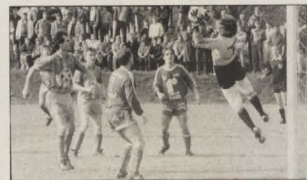
Takih napadov Pliberka je bilo le malo.

no možnosti. Dlopstov strel se je žal odbil od prečke, Wölbl prosti strel je ubranil vratar