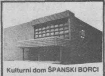
Kulturni dom ŠPANSKI BORCI