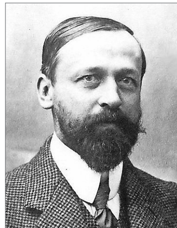
Slika 2: prof. dr. Maks Fabiani (1865–1962)