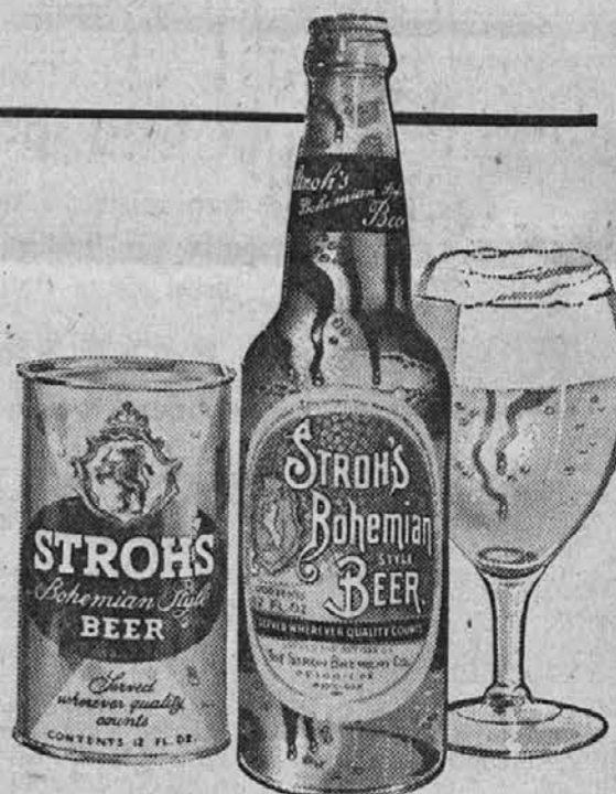
The Stroh Brewery Co., Detroit 26, Michigan

Stroh's je edino ameriško pivo varjeno na ognju!