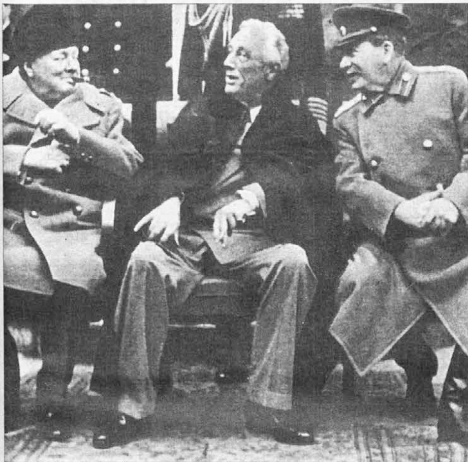
Veliki trije Churchill, Roosevelt in Stalin