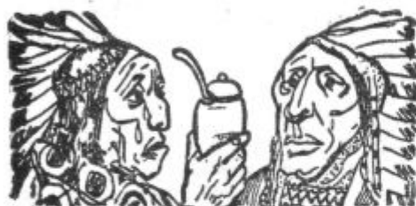
Kornstalk in Katahasa, sloveča poglavarja, na katera še danes živi spomin