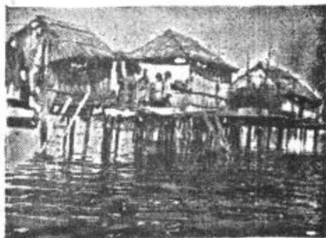
Posamezna indijanska plemena so imela svoje vrvave na jezirih