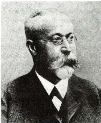
Slika 1. Ferdinand Braun (1850–1918).

Najprej je pod vodstvom Geoga Hermanna Quinckea raziskoval nihanje strun in palic. Nato je preučeval vpliv tlaka na topnost soli. Leta 1874 ga je zanimalo, kako prevajajo električni tok nekateri minerali. Braun je ugotovil, da tok pogosto ni sorazmeren z napetostjo in torej ne velja Ohmov zakon. Poleg tega je bil upor odvisen od smeri. Na kristal je priključil kovinsko konico in drugi priključek ter tok dobil samo v eni smeri. Naprava je delovala kot usmernik. Poskusi z visokofrekvenčnim tokom so ga leta 1897 pripeljali do katodne cevi. Izdelal je tudi natančen elektrometer. Leta 1898 se je Braun začel ukvarjati s prenašanjem Morsovih znakov z visokofrekvenčnimi tokovi tudi po vodi. Pri tem je sledil Guglielmu Marconiju, ki si je že od leta 1897 prizadeval, da bi z radijskimi valovi prenašal sporočila. Dosegel je razdaljo okoli 15 km, a te razdalje ni bilo lahko preseči. Višja napetost ni pomagala. Nekaj večjo razdaljo so dosegli le z 300 m dolgo žico kot anteno, ki je visela z balona. Tedaj so odajno anteno priključili neposredno na krog z izvirom. Električno nihanje v anteni ni imelo določene frekvence in je bilo močno dušeno. Braun je dognal, da precej energije porabi iskra v iskrišču, ki je bilo od Hertzevih časov sestavni del kroga. Z nihajnim krogom iz kondenzatorja in tuljave