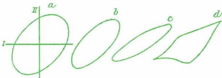
Slika 4. Lissajousove krivulje, ki jih je Braun opazoval neposredno na zaslonu svoje cevi.

Nato je skozi tuljavico z navpično osjo spustil izmenični tok in postavil pod njo paličasti magnet, ki ga je hitro vrtel okoli navpične osi. Na zaslonu je Braun dobil sklenjene krivulje, če se je magnet vrtel s frekvenco, s katero je nihal tok, in s primerno fazno razliko. Opazoval je Lissajousove krivulje, ki nastanejo, ko sestavimo nihanji v pravokotnih smereh (slika 4). Uporabil je tuljavico s pravokotnima osema v dveh krogih, ki sta bila induktivno sklopljena. Opazoval je, kako se je oblika krivulje spremenila, ko je v enega izmed krogov vključil kondenzator.