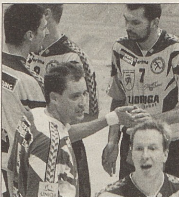
Dobljani se veselijo jasne zmage proti Hartbergu.