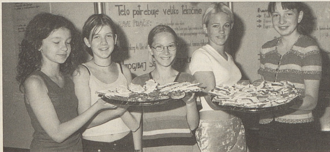
Predvsem mladina se zaveda pomena bioloških produktov. Na Slovenski gimnaziji so npr. priredili teden bio-produktov.