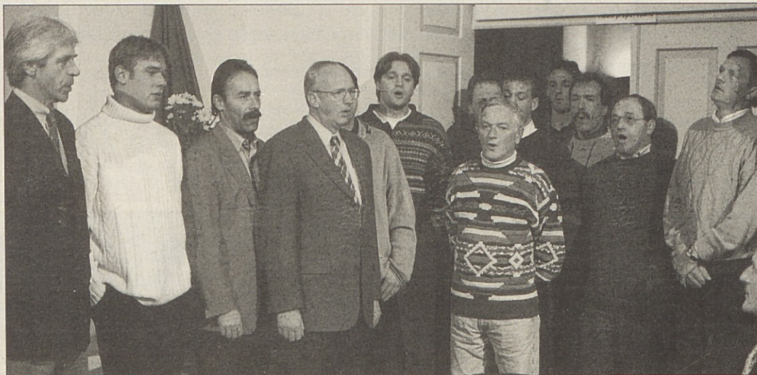
Pri snemanju zgoščenke „Eno pesem hočmo peti - Koledovanje na Koroškem“ je sodelovalo 284 pevcev, med drugim tudi pevci z Radiš (slika). Predstavitve zgoščenke je bila v Borovljah, sledile pa bodo mdr. tudi še predstavitve v Podjuni in Šentjakobu.