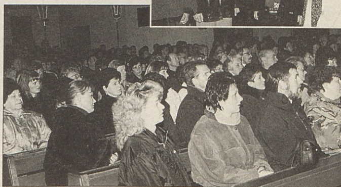
Obe cerkvi, tako v Borovljah (slika spodaj) kakor v Železni Kapli, sta ob predstavitvenem koncertu zgoščenke „Čar božiča“ bili nabito polni. Slika desno Kvartet Borovlje).

tamo in kličemo na mnoga zdrava in srečna leta. Čestitkam uredništva NT se pridružuje Slovensko društvo upokojencev Šentjakob.