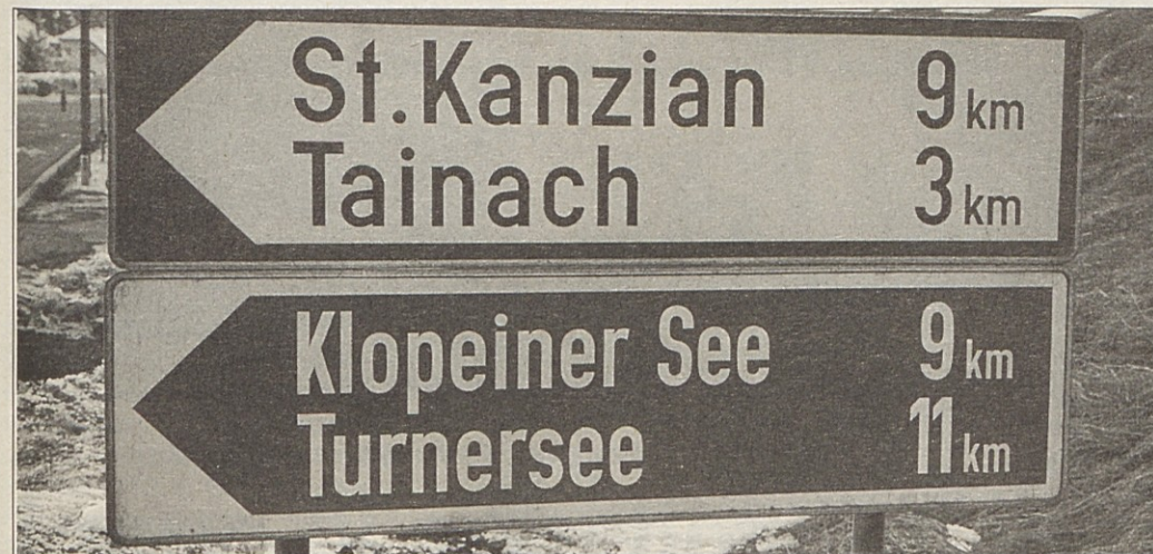
Kažipot pri Betlarjevem križu, kjer bi po mnenju SGZ moral biti odvoz za osrednjo Podjuno.