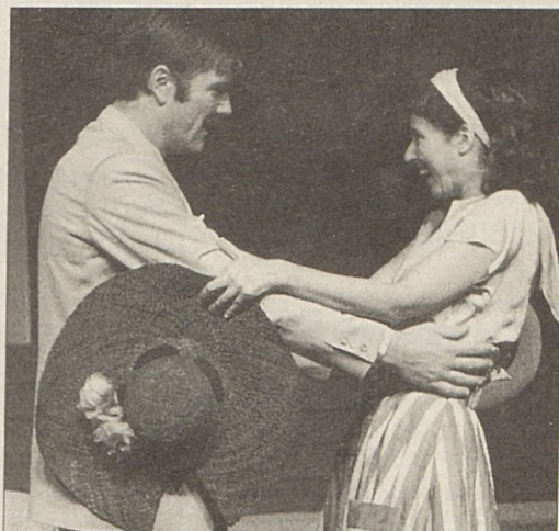
Stalno gledališče iz Trsta bo gostovalo v Celovcu.

Karte lahko naročite na KKZ: 0463/516243 ali jih dobite pri večerni blagajni.