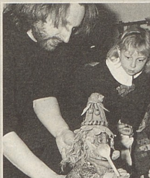
Za dolgoletno delo in za organizacijo festivala ANIMA so šmihelski lutkarji prejeli priznanje.