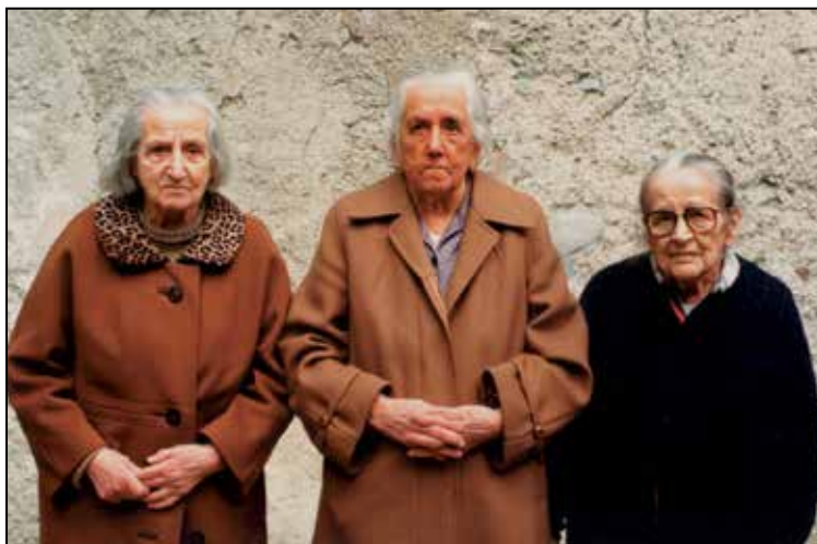
Čipkarice iz Železnikov, posnete na otvoritvi razstave Kljekljali so jih moja mati. Takrat so bile to tri najstarejše klekljarice.

Zadnji dve leti življenja je preživela v domu starejših občanov v Škofji Loki, kjer je julija leta 2000 tudi umrla.