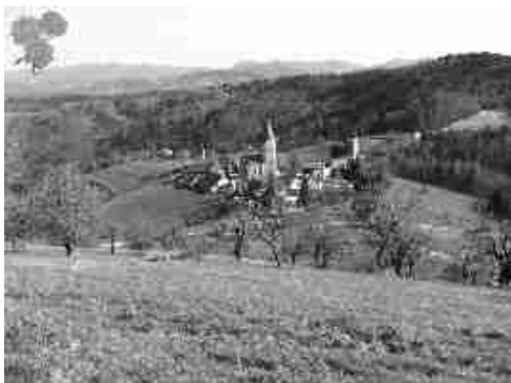
Svetina - najlepši hribovski kraj v Sloveniji za leto 2004

Upamo, da bo objava v Štorskem občanu predramila koga in pripomogla k ureditvi »teh cvetk«