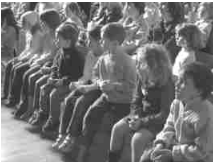
Otroci zavzeto opazujejo predstavo

Knjige vplivajo na jezikovni razvoj ter mišljenje in otroci, ki v rani mladosti začutijo lepoto varnega naročja s knjigo v roki, bodo vse življenje radi brali. In teh otrok v Štorah gotovo ni malo! Letos je bralno priznanje prejelo kar 36 otrok iz vrtca Lipa in 11 otrok iz vrtca v Kompolah. Vsem še enkrat čestitamo!