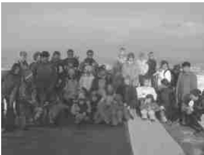
Pohod na Stari grad (november 2004)

Hojo štejejo med nepogrešljive prvine sodobne športne vzgoje in zdravega načina življenja v vseh starostnih obdobjih. To je najbolj preprosta, najcenejša in najbolj dostopna športna dejavnost, ki lahko zmanjšuje negativne posledice sodobnega življenja. Čustven in kulturn odnos do narave sta danes splošno priznani vrednoti. S hojo in bivanjem v naravi oblikujemo čustven odnos do narave, ki je podlaga za poznejše samostojno odhajanje v naravo. Čustven odnos do narave je tudi podlaga za naravovarstveno in okoljevarstveno ozaveščanje. V letošnjem šolskem letu smo planirali pet izletov. Naš prvi izlet smo opravili v mesecu oktobru. Cilj izleta je bil »Vrunčev dom » na Svetini. Drugi izlet je bil v mesecu