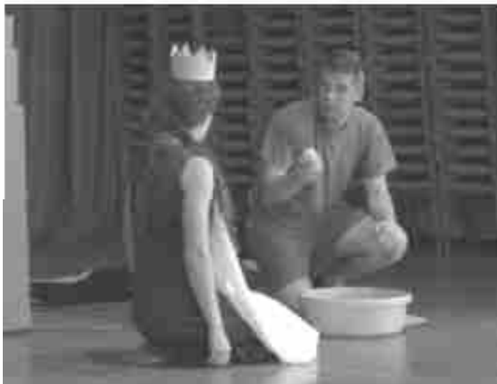
Predstava Žabji kralj

Teden slovenske knjige smo v Štorah obeležili na prav poseben način. V sredo, 20. aprila 2005, je knjižnica Štore v sodelovanju z vrtcem Lipa počastila najmlajše bralce tekmovalce za bralno značko »Bralček palček« s slovesnim zaključkom bralne pustolovščine, na katero so se v tem šolskem letu podali skupaj s svojimi starši. Za lično potrdilo, ki, upajmo, že krasi steno ali knjižno polico otroške sobe, je moral vsak otrok »prebrati«, pripovedovati, oziroma prisluhniti zgodbam vsaj treh knjig in povedati eno pesmico.