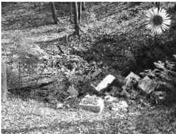
To divje odlagališče se žal nahaja tik pod Svetino.