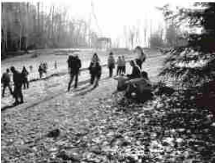
Pohod na Resevno (02.04.2005)

Hojo štejejo med nepogrešljive prvine sodobne športne vzgoje in zdravega načina življenja v vseh starostnih obdobjih. To je najbolj preprosta, najcenejša in najbolj dostopna športna dejavnost, ki lahko zmanjšuje negativne posledice sodobnega življenja. Čustven in kulturn odnos do narave sta danes splošno priznani vrednoti. S hojo in bivanjem v naravi oblikujemo čustven odnos do narave, ki je podlaga za poznejše samostojno odhajanje v naravo. Čustven odnos do narave je tudi podlaga za naravovarstveno in okoljevarstveno ozaveščanje. V letošnjem šolskem letu smo planirali pet izletov. Naš prvi izlet smo opravili v mesecu oktobru. Cilj izleta je bil »Vrunčev dom » na Svetini. Drugi izlet je bil v mesecu