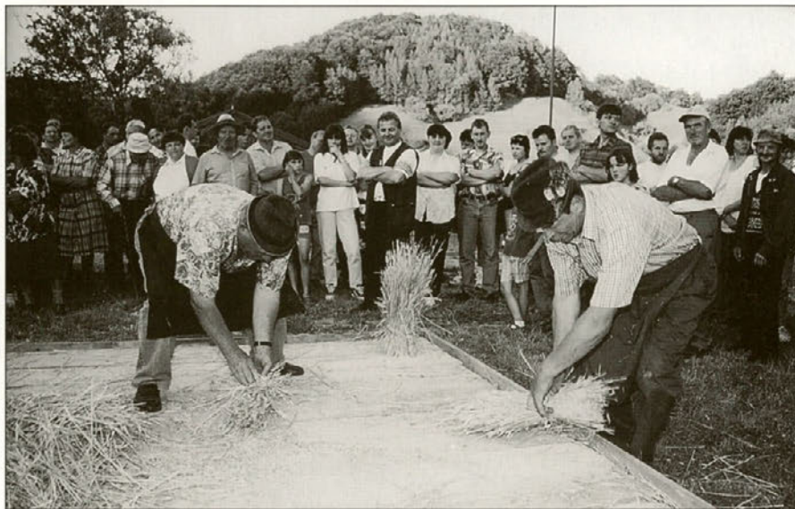
...in na odru je ostalo zlatorumeno zrnje in slama, ki so jo kmetje znali prav tako koristno uporabiti.

Opogumile so se tudi grabljice. Kar šest se jih je potegovalo za prva tri mesta. Pomerile so se v grabljanju trave, ki