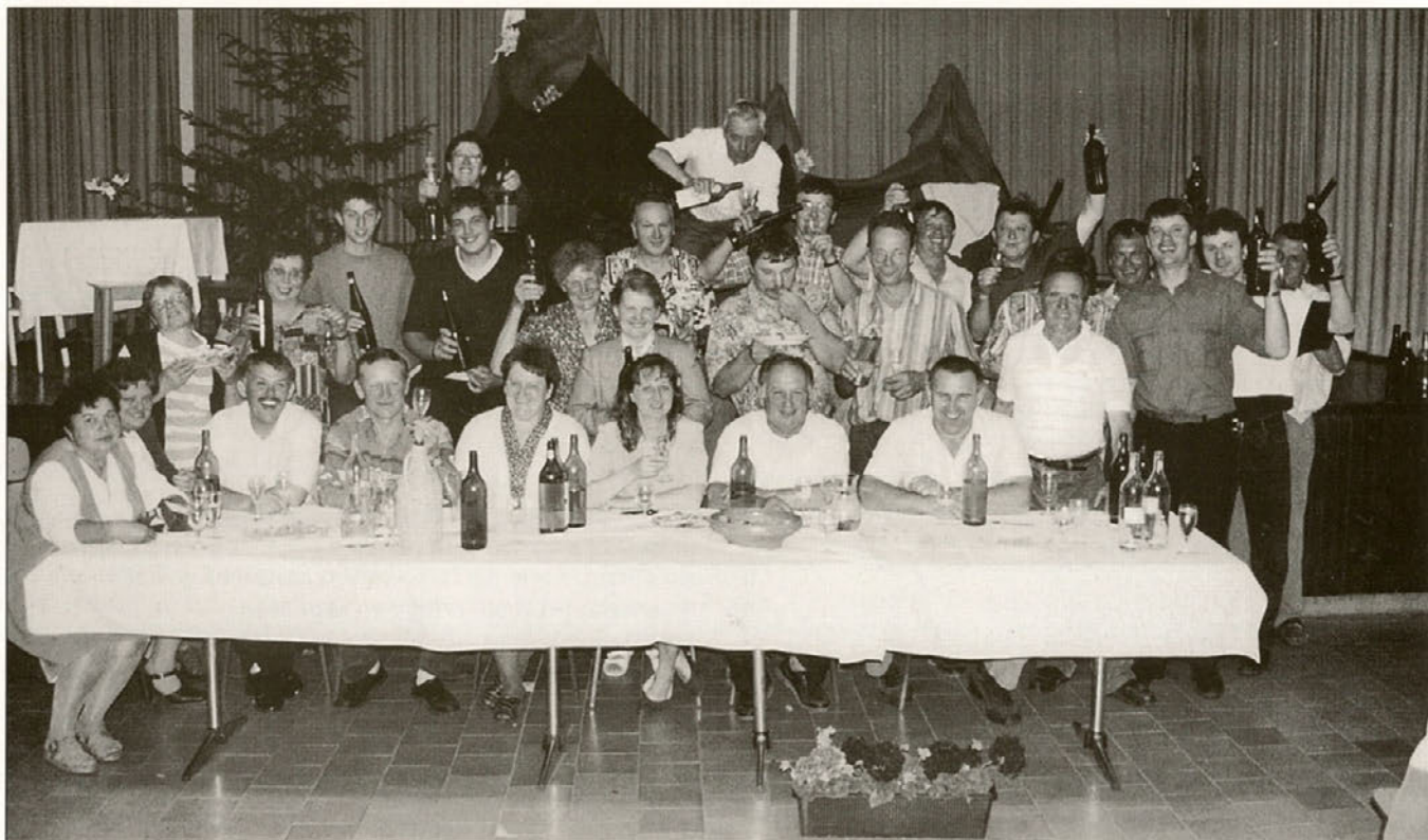
Dobra kapljica pripomore k veselemu razpoloženju, ampak ne le to, prepotrebna je pri trdem vsakdanjem kmečkem delu.

Že osmo leto zapovrstjo je zadnji vikend v mesecu maju rezerviran za kmečki praznik v Stopercah. Ljudje so se ga kar privadili in za "ta prave Stoperčane" ima ta praznik enako vrednost kot ostali državni prazniki. Stoperce so tako tudi letos gostile ljudi željne informacij, kmetijskih in vinogradniških nasvetov in seveda tudi ljudi željnih smeha, razvedrila in dobre kapljice. Vsega tega je bilo v petek, 26. maja in v soboto, 27. maja na pretek. In kdo je poskrbel za to, da so s prireditev odhajali srečni in veseli obrazi?