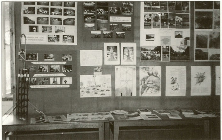
Fotografije z izletov, razglednice, risbe, knjige ... z razstave.

Razstava v šoli je prikazala opremo planinca za pot v gore, raznolike iz-