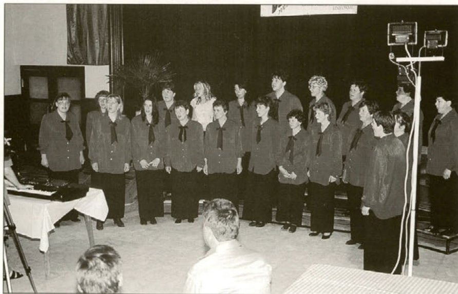
Ženski pevski zbor KUD Stane SEVER Ribnica na Pohorju