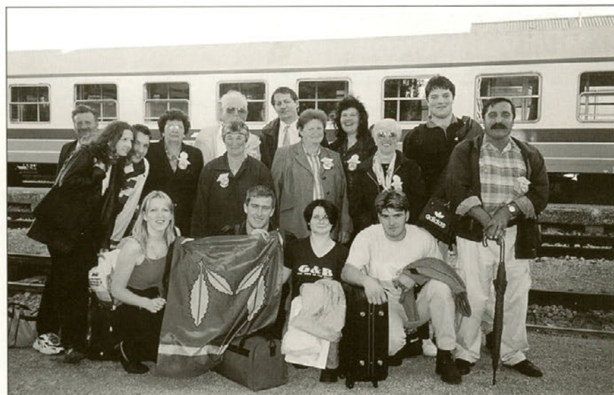
"Povsod je lepo, doma je najlepše." Pregovor še kako drži.