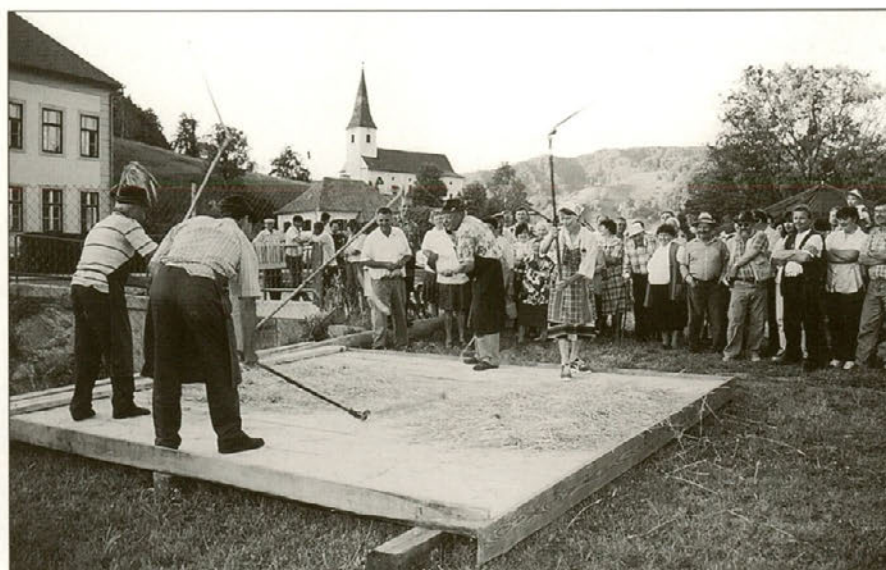
Cep, za mnoge že pozabljeno kmečko orodje, so spretni mlatiči znova spretno zavihteli...

Sledilo je tekmovanje v košnji. Nanj je bilo prijavljenih osem koscev. Komi-