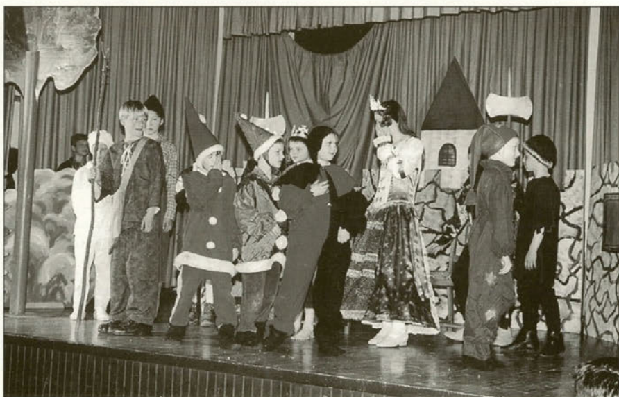
Utrinek iz igre Bedak Pavlek.