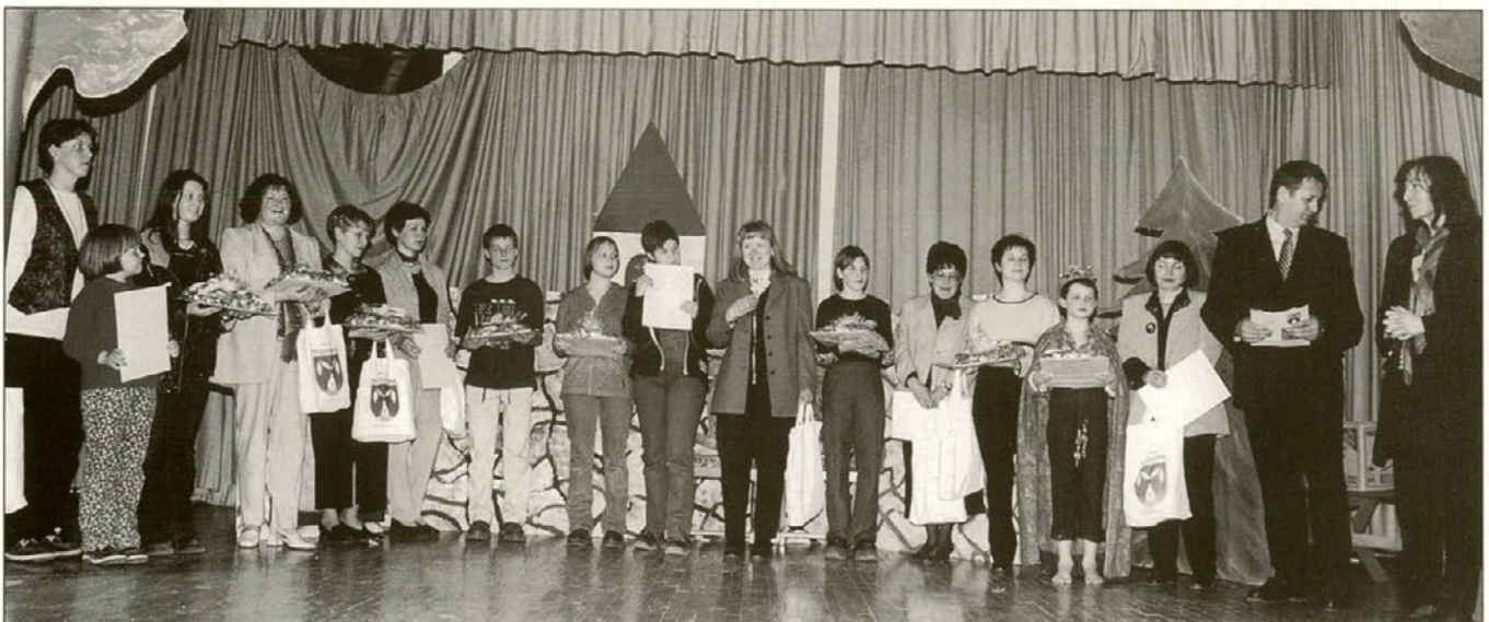
Zbrani so prejeli simbolična darila.