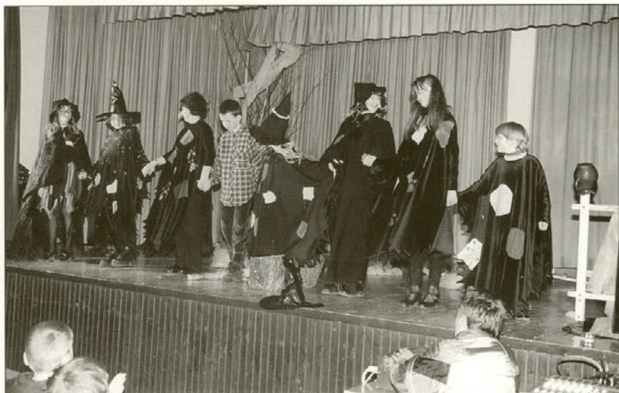
Utrinek iz igre Mala čarovnica, ki ni mogla biti zlobna.

Za udeležence – igralce, režiserje oziroma mentorje in spremljevalce skupin, za tehnike in organizatorje – je bilo srečanje sicer naporno, vendar lepo in vredno truda. V dopoldanskem delu so bili naklonjena in pozorna publika učenci OŠ Majšperk, popoldan pa Stoperčani, ki so z obiskom dokazali svojo tradicionalno povezanost z gledališkim ustvarjanjem.