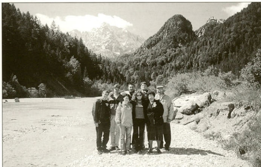
Tudi Gorenjska je lepa in turistično vabljava.