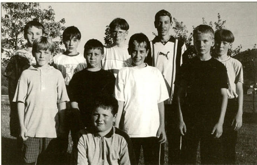
Ekipa je vložila ves trud v tekmovalno vajo, in tako osvojila 5. mesto.

vsaka mladinska ekipa na državnem tekmovanju pravico do dvakratne izvedbe vaje. Tekmovalci so po nekaj pretočenih solzah in ohrabrujočih besedah trenerja ponovno zložili orodje in opremo ter izvedli vajo še enkrat. Tokrat jim je uspelo več kot odlično, saj so dosegli drugi čas vaje. Vendar se je enemu izmed tekmovalcev zalomilo in prislužili so si 10 kazenskih točk. Zaradi problemov pri izvedbi vaje je ekipi padla koncentracija, tako tudi štafetnega teka z ovirami niso opravili najbolje.