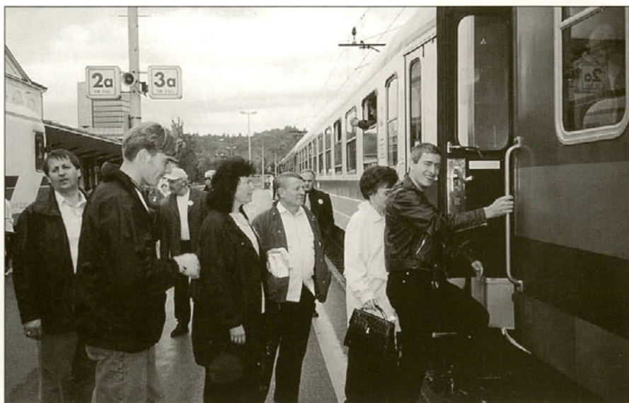
"Horuk na haloški cug!"

Naš drugi postanek je bil v Ljubljani, da tudi v našem glavnem mestu ne bi pozabili na Haloze in Haložane. Tudi tukaj so nas sprejeli gostitelji, predstavili mestno občino, državni zbor in Turistično zvezo Slovenije. Sledil je kulturni program ter pozdravi županov sodelujočih občin , in sicer: Vidma, Gorišnice, Majšperka ter seveda podžupana Občine Zavrč . Preden smo odšli iz Ljubljane, smo se še okrepčali s kosilom – nato pa spet veselo po tirih