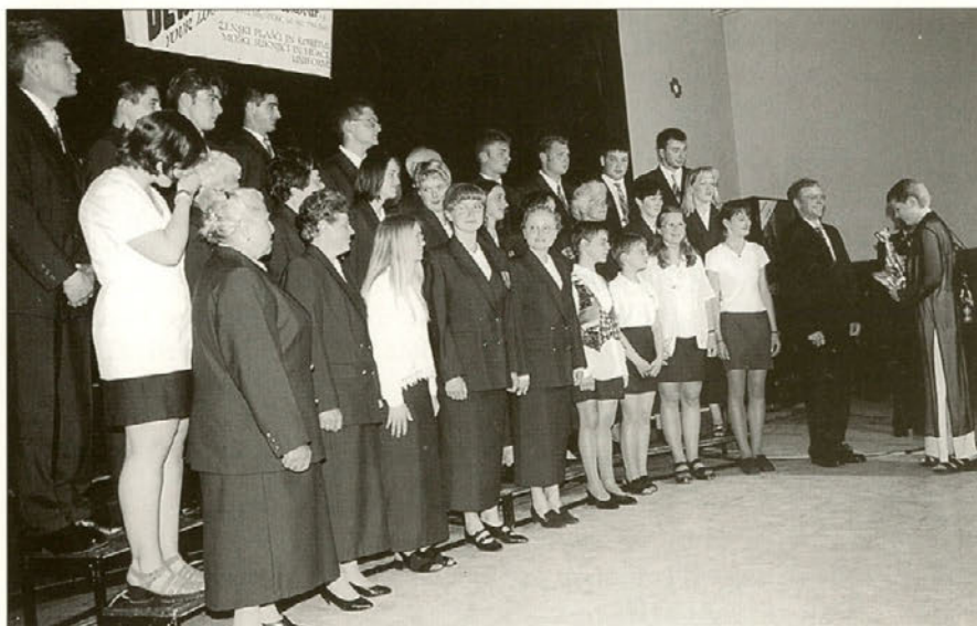
Mešani pevski zbor Sv. Miklavža KUD Majšperk