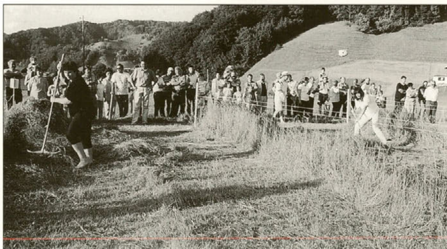
...in ženske v zgrabljanju.