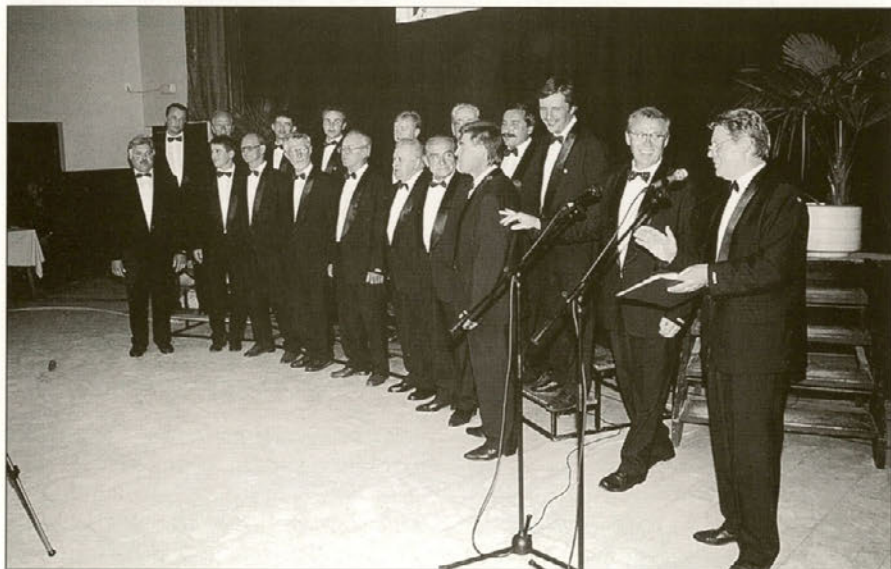
Moški pevski zbor DPD Svoboda Majšperk

Vse poslušalke in vsi poslušalci in seveda vsi Slovenci smo lahko srečni in veseli, da prelepa slovenska pesem ni in ne bo zamrla. Dokaz za to trditev je iz leta v leto večje število pevskih zborov, iz leta v leto lepše in kvalitetnejše izvajanje pesmi posameznih zborov. Nena-