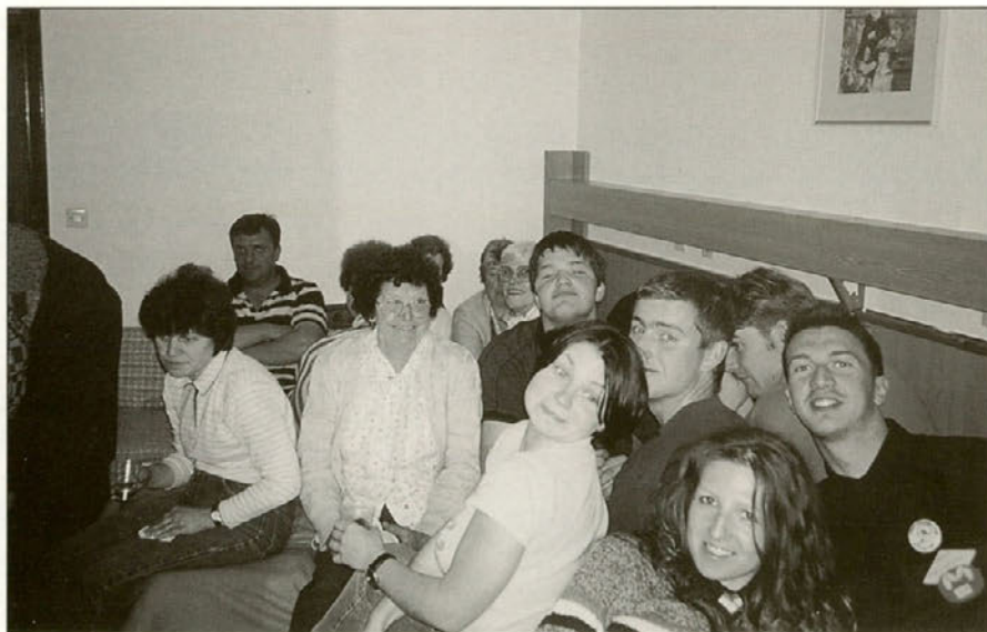
Ob dobri kapljici in hrani smo se veselili in navezovali stike pozno v noč.