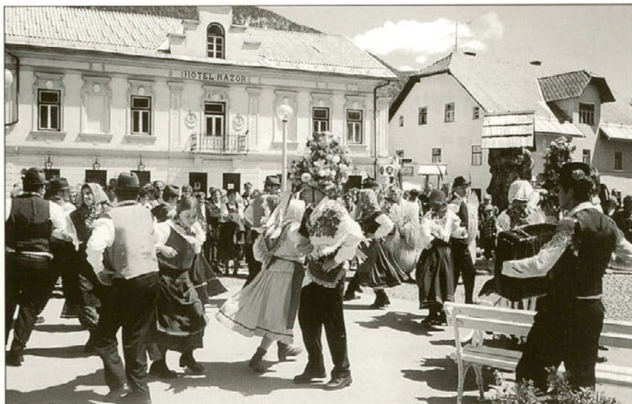
Skupine iz Vidma so predstavile ljudske običaje v Halozah.