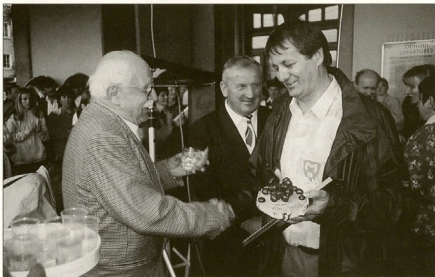
Župan Občine Majšperk ob izročanju simboličnega darila predstavniku ljubljanske občine.