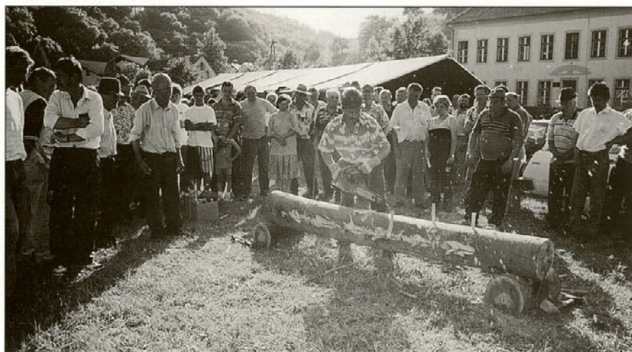
Pomerili so se v poznavanju in spretnosti gozdarskih del.