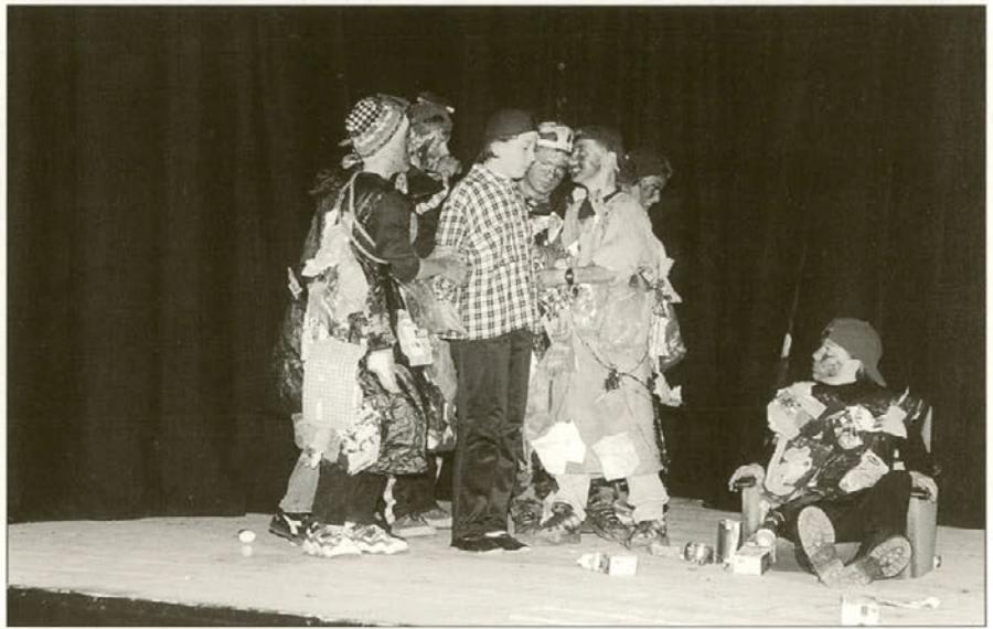
Utrinek iz igre Črno in belo.