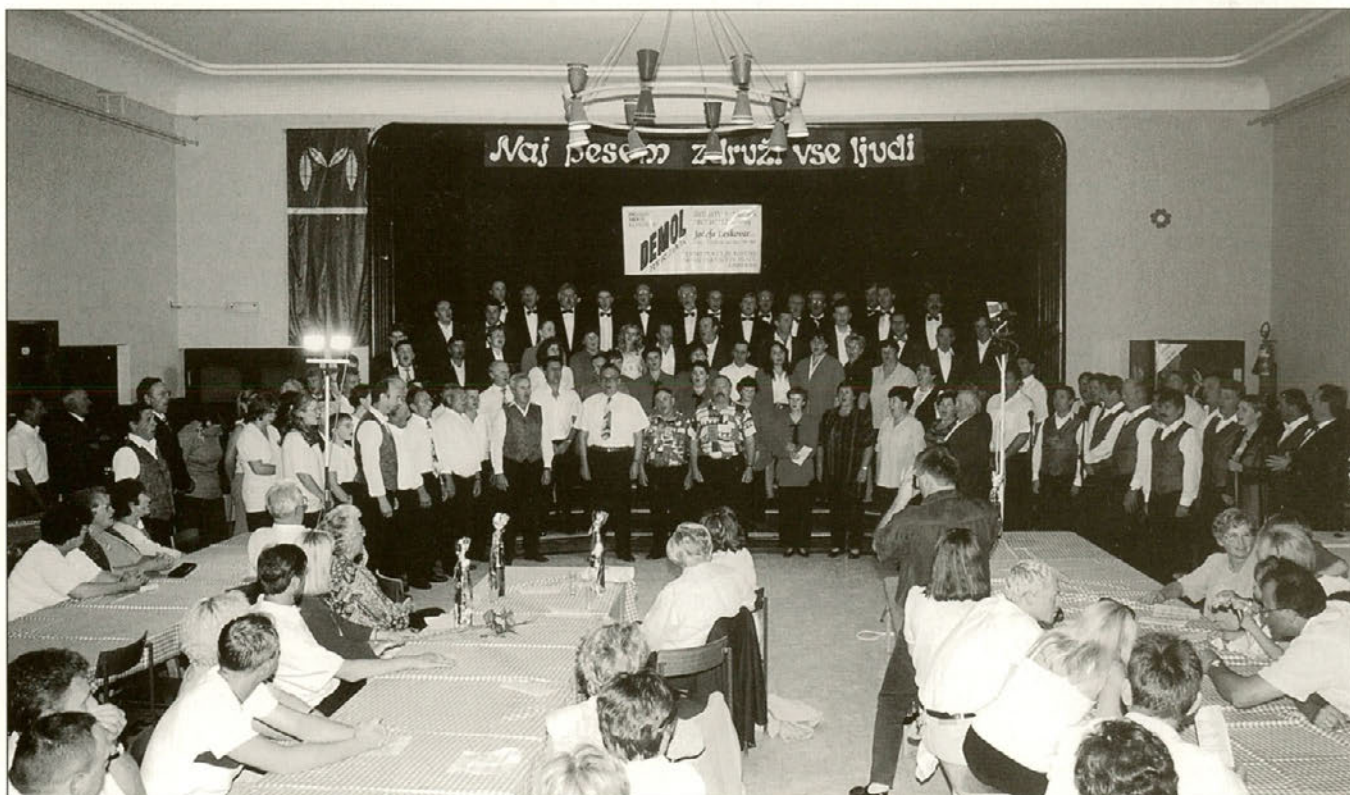
Vsi zbori so na koncu zapeli skupno pesem "Pozimi pa rožice ne cveto"