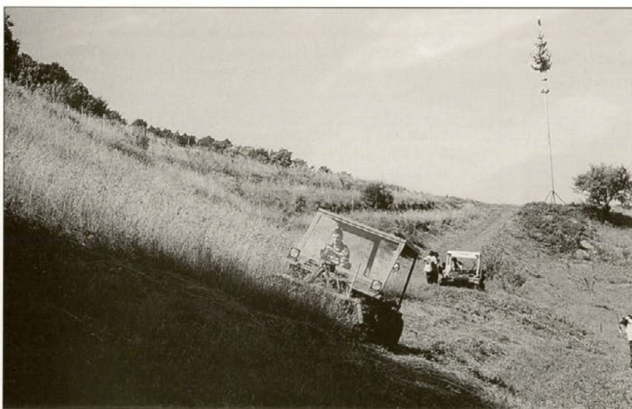
Precejšnje zanimanje je zbudil prikaz, za Haloze zelo primerne kmetijske mehanizacije.

Organizatorici praznika sta bili dve društvi, in sicer Združenje rejcev plemenskih telic Stoperce in Društvo gospodinj Stoperce . Svoj del k prireditvi so dodale tudi učiteljice in učenci Osnovne šole Majšperk, podružnica Stoperce , ki so praznovali dan šole . Letos so se še posebej potrudili in pripravili projekt z naslovom " V kraljestvu Zlatoroga ". V projektu so sodelovali vsi učenci te podružnične šole. Kljub njihovi šolski obveznosti in mladosti so se na svoj nastop izvrstno pripravili. Približali so nam mnogokrat tako oddaljene gore in nam nazorno opisali vso lepoto gora. To čudovitost so jim pomagali pričarati pevci pevskega zbora DPD Svoboda Majšperk in Ljudski pevci iz Stoperc . Nastopajočim je uspevalo pritegniti gledalce in jih razveseljovati skozi vso prireditev. Gle-