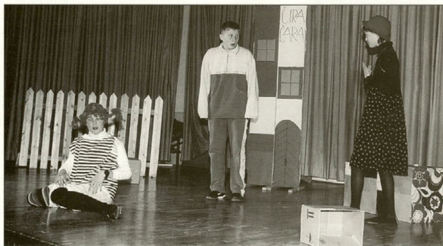
Utrinek iz igre Pika nogavička med svojimi.