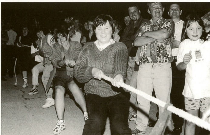
Ob zaključku dneva so se še udeleženci pomerili v šaljivih igrah.