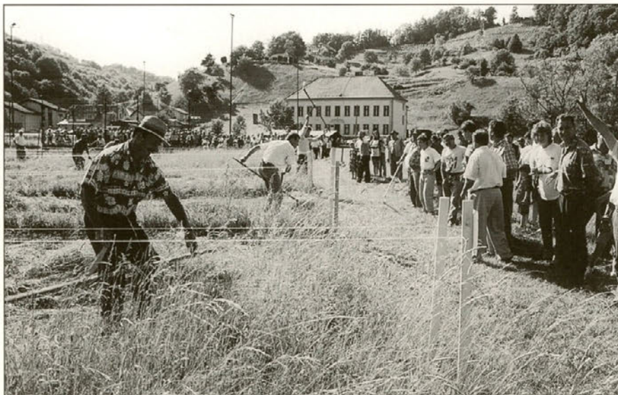
Tudi letos so se možje pomerili v košnji sena ...

Isti obiskovalci so si lahko ogledali tudi kulinarično razstavo jedil, ki so jih nekoč gospodinje pripravljale žanjicam in jedi, ki jih ob tej priložnosti pripravljajo danes. Po "obtešku", ki je bil na razstavi, lahko sklepamo, da so žanjice pričele z žetvijo že v zgodnjih jutranjih urah. Dobile so tudi dopoldansko malico, kosilo in po končanem delu še večerjo. Danes seveda žetev ne traja ves dan, saj so skoraj povsod žanjice nadomestili žetveni stroji, ki jih zmoro obvladovati le en človek. Tako so se spremenile tudi jedi ob žetvi. Tudi ta jedila so bila na razstavi, pripravile pa so jih gospodinje Društva gospodinj Stoperce . Iz doma krajanov smo se preselili v šolske prostore, kjer nas je zopet pričakala razstava, ki je v sliki predsta-