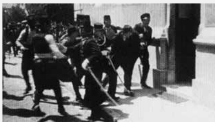
Vir C (2): Aretacija Nedeljka Čabrinovića, ki je prvi vrgel bombo in zadel avtomobil s prestolonaslednikovim spremstvom. Dve leti pozneje je umrl v zaporu v Terezinu.