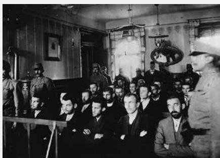
Vir C (4): Atentatorji v sodni dvorani. Nedeljko Čabrinović drugi z leve. Sledi Gavrilo Princip. (Fototeka MNZS.)

(Vir: Štepec, M. et al. (2010). Slovenci + prva svetovna vojna 1914–1918 . Ljubljana: Muzej novejšje zgodovine, str. 11; Fototeka MNZS; http://www.rtvsl.si/kultura/razglednice-preteklosti/slovenski-znanec-prvi-atentator-na-prestolonaslednika-franca-ferdinanda/340560 (dostop: 13. 9. 2014).)