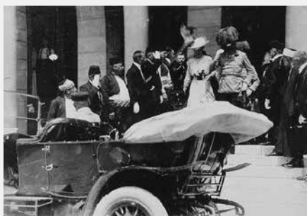
Vir C (1): Obisk Franca Ferdinanda in njegove žene Sofije Hohenberg v Sarajevu 28. junija 1914. Fotografija je bila posneta pred mestno hišo pet minut pred atentatom.