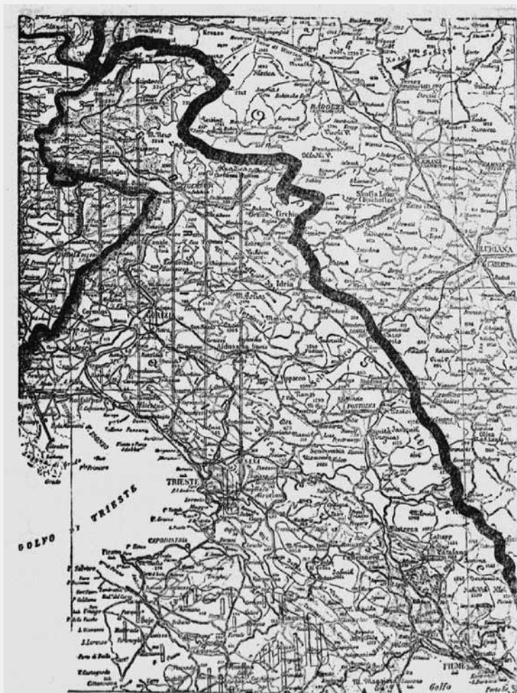
Nova italijanska-avstrijska meja skozi slovenske dežele, kakor so jo načrtali Italijani. (Po zemljevidu iz Italije.)

Vir A (4): Slovenec, 18. 8. 1915, let. 43, št. 187, str. 5. (Posredovalnica za goriške begunce.)