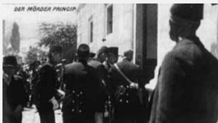
Vir C (3): Atentatorje, v sredini Gavrila Principa, peljejo na sodišče. Zaradi mladoletnosti je bil obsojen na 20 let prisilnega dela, umrl je 28. aprila 1918 v zaporu.