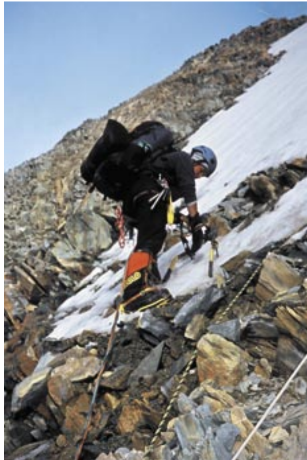
V načrtu sva imela prvo ponovitev severnega grebena Dirana (7266 m) - v smeri so še vedno ostanki fiksnih vrvi prvih plezalcev.

Takrat, po pristopu na Gašerbrum, so mi rekli, da šele zdaj vidim, kaj sploh to pomeni, čeprav je bila stvar dejansko čisto lepo izvedljiva. In tudi letos. K2 sploh ni tak bavlav. Česnova smer, po kateri sva se nameravali povzpeti v alpskem slogu, je povsem izvedljiva, izjemno lepa, ne pretežka. Problem Karakoruma je res vreme, čeprav je to mogoče pri odpravah najpogostejši izgovor. Ampak dejansko je bilo tako. Že leta 2004 smo imeli le eno dovolj veliko okno lepega vremena, da bi poskusili izvesti svoje načrte, a smo bili premalo aklimatizirani, saj smo na Gašerbrum II prišli že v drugem poskusu, kar je bilo premalo, da bi poskusili še s prečenjem. Če (ampak to je spet velik če) bi bilo to letos, ko smo na Broad Peak prišli v četrtem poskusu, dobro aklimatizirani, brez kakršnih koli težav z višino, bi se ga dalo izvesti mnogo lažje. Če bi bil Broad Peak Gašerbrum II, bi prečenje zagotovo poskusila.