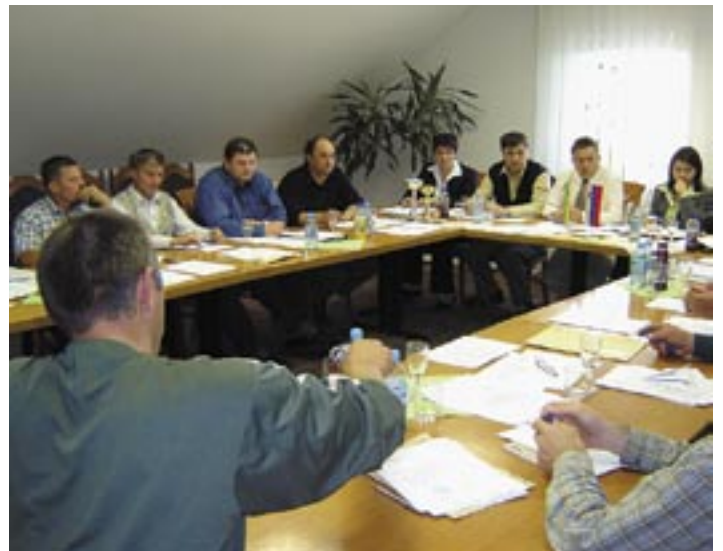
Občan - 18. maj 2005