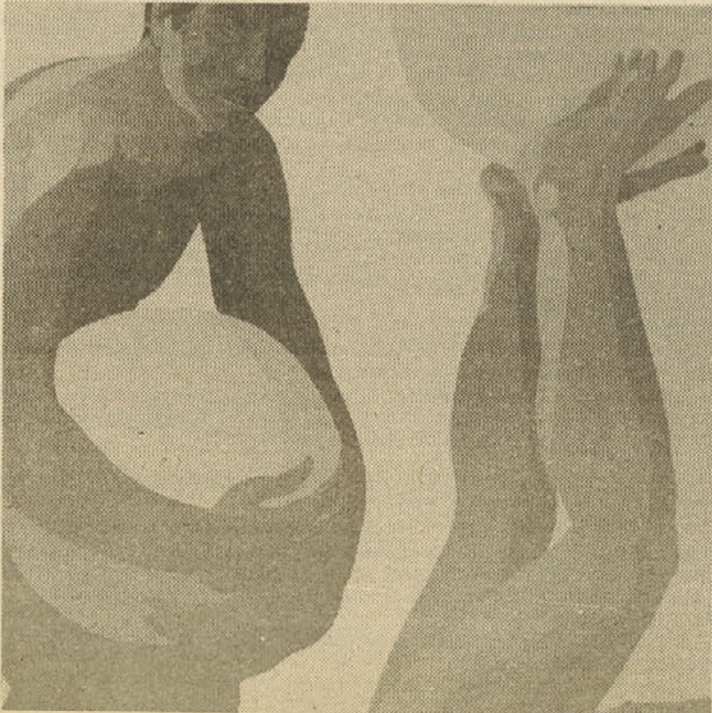
Igra in delo 1987, olje na platnu