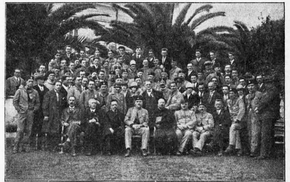
Glavna godišnja skupština mostarske sokolske župe »Aleksa Šantić« u Hercegovom.