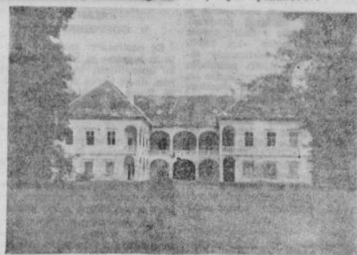
Grad v Turnišču

dističnega kneza zelo vznemirilo. Po proslavi so se gostje razšli, tudi slikar je sedel drugi dan