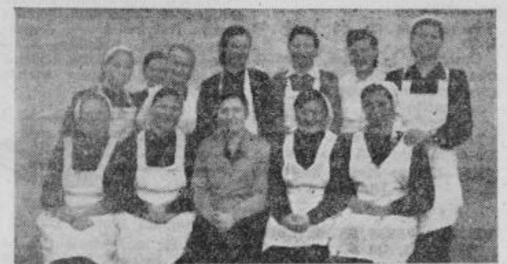
Tečajnice iz Dornave