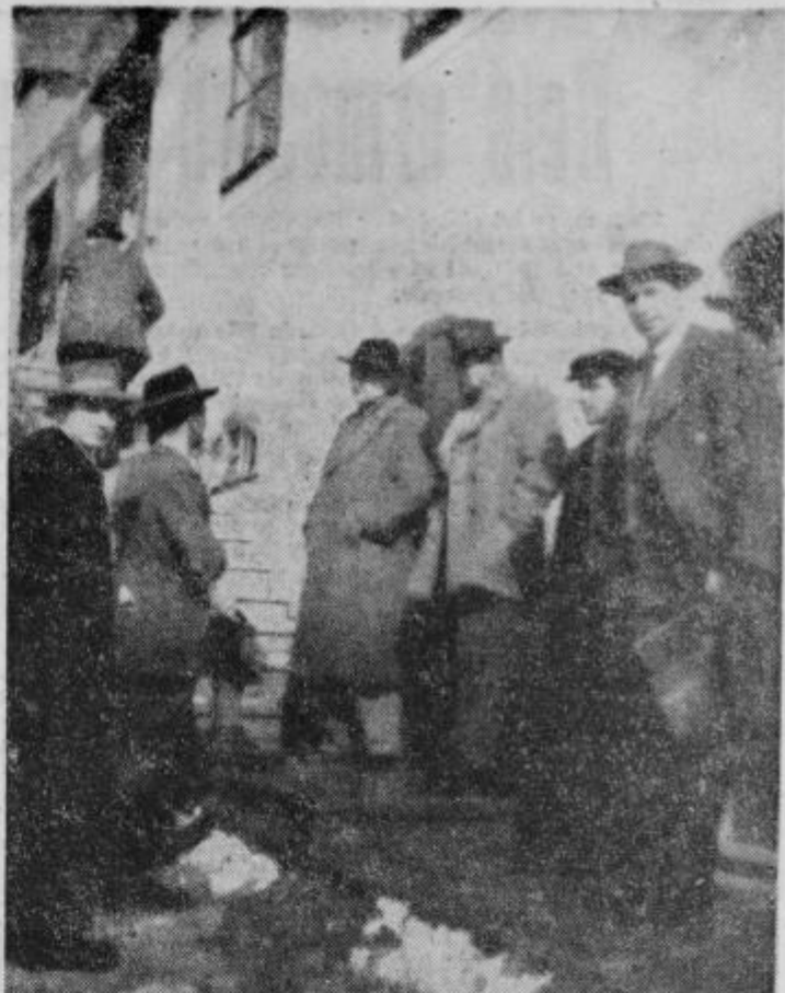
Gostje na seminarju v Desterniku

Tega novega zadržanja vseh rekrutov so bili vsi veselili na vojnem odseku pa tudi ljudje po mestu, ki so to spremembo tudi opazili in pohvalili, da sedaj mladina več tolko ne pije kot včasih. Vse priprave so bile kmalu gotove, dokumenti v redu, spremljevalci na mestu in