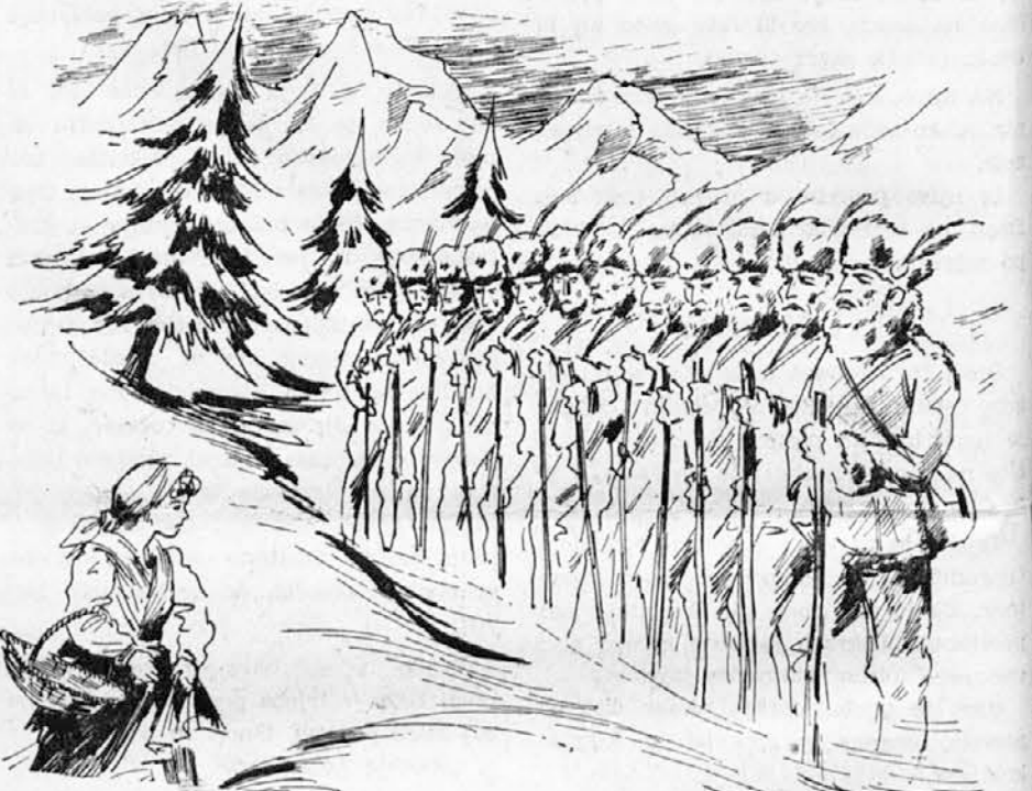
Kar hódi usá razjokana po gori, jo sreča dvanajst inaku ...