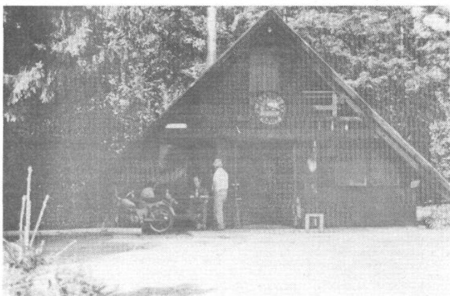
Polharski dom Krim v Mesnicah pod Rakitno