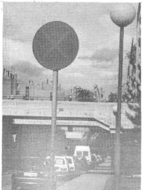
PARKIRANJE PREPOVEDANO. Med drugim je Švabičeva ulica v Trnovem, kjer je prometni znak, da je parkiranje prepovedano, totalno zaparkirana, kar povzroča zelo velike težave, jezo prizadetih in nevarnost, da bo prišlo do nesreč.